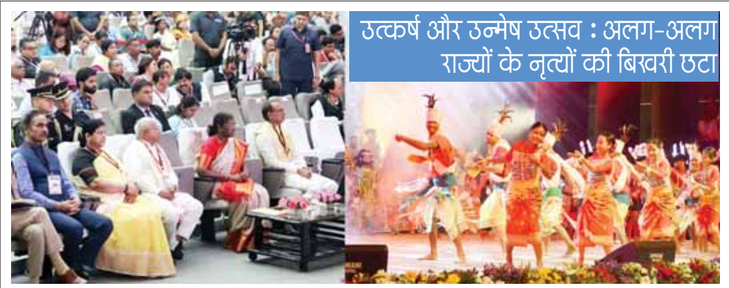
राष्ट्रपति द्रौपदी मुर्मू ने भोपाल स्थित रवीन्द्र भवन में गुरुवार को भारतीय लोक एव जनजातीय अभिव्यक्तियों के राष्ट्रीय उत्सव उत्कर्ष और उन्मेष में जनजातीय लोक नृत्य देखा। राज्यपाल मंगुभाई पटेल व मुख्यमंत्री शिवराज सिंह चौहान भी उपस्थित थे।

भोपाल, देशबन्धु। राजधानी में आयोजित राष्ट्रीय उत्सव उत्कर्ष और उन्मेष उत्सव में राष्ट्रपति श्रीमती मुर्मू के सम्मुख विभिन्न नृत्यों की झलकियां प्रस्तुत की गईं। इस विहंगम, मनोहारी और आकर्षक प्रस्तुति में कलाकारों ने विभिन्न राज्यों और अंचलों के नृत्य प्रस्तुत किए। आज से 6 अगस्त तक हो रहे इस भव्य समारोह में सौ से अधिक भाषाओं में 14 देशों के 575 से अधिक प्रतिभागी भाग ले रहे हैं। समारोह में संगीत नाटक अकादमी, साहित्य अकादमी, आजादी के अमृत महोत्सव तथा हर घर हेल्दी मिशन पर केन्द्रित लघु फिल्मों का प्रदर्शन किया गया। राष्ट्रपति श्रीमती मुर्मू ने हर घर हेल्दी मिशन के अंतर्गत विश्व रिकार्ड बनाने के लिए केन्द्रीय संयुक्त सचिव संस्कृति श्रीमती उमा नंदूरी तथा माय एफएम रेडियो के पदाधिकारी को प्रमाण पत्र प्रदान किया।