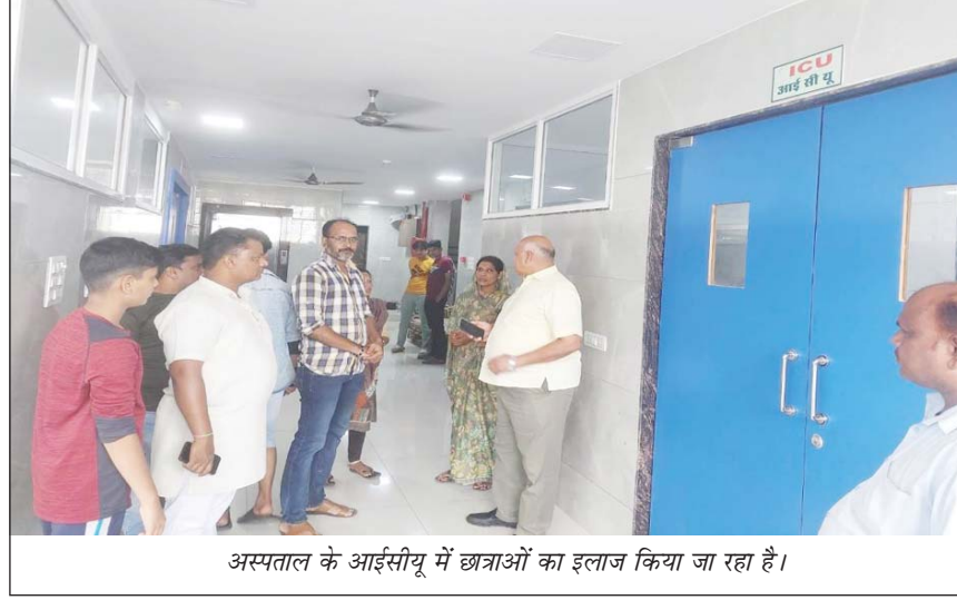
अस्पताल के आईसीयू में छात्राओं का इलाज किया जा रहा है।