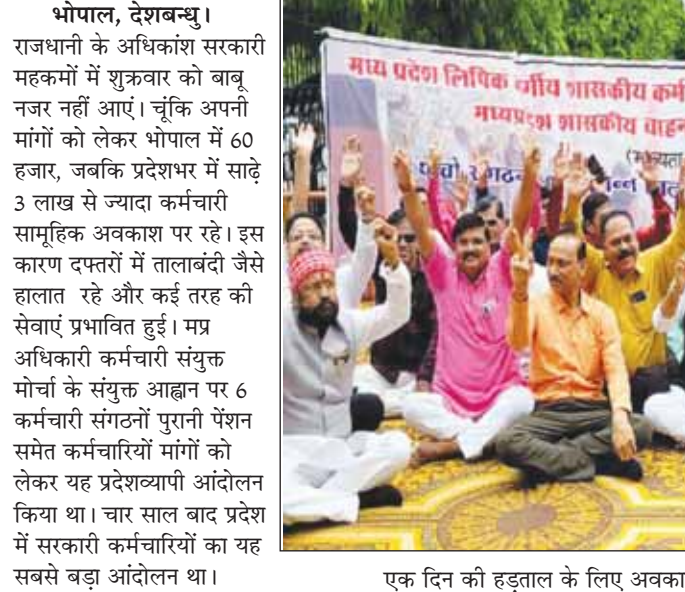
भोपाल, देशबन्धु। राजधानी के अधिकांश सरकारी महकमों में शुकवार को बाबू नजर नहीं आए। चूँकि अपनी मांगों को लेकर भोपाल में 60 हजार, जबकि प्रदेशभर में साढ़े 3 लाख से ज्यादा कर्मचारी सामूहिक अवकाश पर रहे। इस कारण दफ्तरों में तालाबंदी जैसे हालात रहे और कई तरह की सेवाएँ प्रभावित हुईं। मप्र अधिकारी कर्मचारी संयुक्त मोर्चा के संयुक्त आह्वान पर 6 कर्मचारी संगठनों पुरानी पेंशन समेत कर्मचारियों मांगों को लेकर यह प्रदेशव्यापी आंदोलन किया था। चार साल बाद प्रदेश में सरकारी कर्मचारियों का यह सबसे बड़ा आंदोलन था।

विधानसभा चुनाव से पहले मध्यप्रदेश में कर्मचारी सड़क पर उतर गए हैं। इसके चलते कर्मचारी शुकवार को एक दिन की हड़ताल के लिए अवकाश पर रहे। इससे तहसीलों से लेकर निकायों तक जनता से जुड़े काम नहीं हो सके। चूँकि प्रदेश के इत्वारि पहले से 3 दिन के अवकाश पर हैं। पटवारियों के हड़ताल पर रहने से नामांकन, सीमांकन, बंटान जैसे काम नहीं हो रहे हैं। वहीं शुकवार को तृतीय वर्ग और चतुर्थ वर्ग के