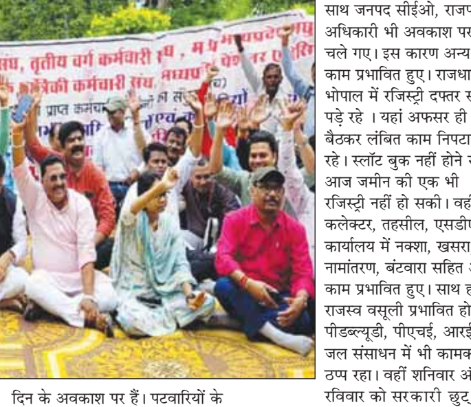
साथ जनपद सीईओ, राजपत्रित अधिकारी भी अवकाश पर चले गए। इस कारण अन्य काम प्रभावित हुए। राजधानी भोपाल में रजिस्ट्री दफ्तर सूने पड़े रहे। यहां अफसर ही बैठकर लिखित काम निपटाने रहे। स्टांट बुक नहीं होने से आज जमीन की एक भी रजिस्ट्री नहीं हो सकी। वहीं कलेक्टर, तहसील, एसडीएम कार्यालय में नक्शा, खसरा, नामांतरण, बंटवारा सहित अन्य काम प्रभावित हुए। साथ ही राजस्व वसूली प्रभावित होगी। पीडब्ल्यूडी, पीएचई, आरईएस, जल संसाधन में भी कामकाज ठप रहा। वहीं शनिवार और रविवार को सरकारी छुट्टी होने से भी काम नहीं हो सकेगे। यानी, लगातार 3 दिन तक जनता से जुड़े काम नहीं हो सकेगे।

विधानसभा चुनाव से पहले मध्यप्रदेश में कर्मचारी सड़क पर उतर गए हैं। इसके चलते कर्मचारी शुकवार को एक दिन की हड़ताल के लिए अवकाश पर रहे। इससे तहसीलों से लेकर निकायों तक जनता से जुड़े काम नहीं हो सके। चूँकि प्रदेश के इत्वारि पहले से 3 दिन के अवकाश पर हैं। पटवारियों के हड़ताल पर रहने से नामांकन, सीमांकन, बंटान जैसे काम नहीं हो रहे हैं। वहीं शुकवार को तृतीय वर्ग और चतुर्थ वर्ग के