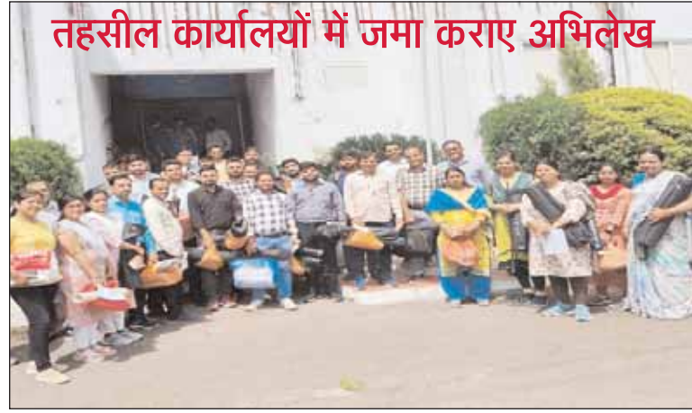
तहसील कार्यालयों में जमा कराए अभिलेख

भोपाल, देशबन्धु। मध्यप्रदेश के 19 हजार पटवारियों ने अपनी मांगों को लेकर सोमवार को कलमबंद हड़ताल शुरू कर दी है। हड़ताल पर जाने से पहले इन्होंने राजधानी भोपाल सहित सभी जिलों के तहसील कार्यालयों में पहुंचकर अपने-अपने अभिलेख जमा कराए। दरअसल मध्यप्रदेश के पटवारी अपनी मांगों को लेकर चरणबद्ध आंदोलन कर रहे हैं। आंदोलन के पहले चरण में 21 अगस्त से यह सभी सरकारी व्हाटाअप समूह से विरक्त हो गए थे और ऑनलाइन काम का बहिष्कार किया था।