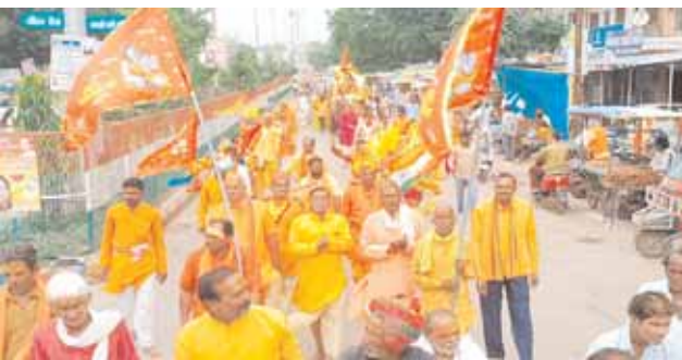
श्रद्धालुओं ने अभिषेक कर भगवान शिव के दर्शन किए वहीं गम का रिस्ते सिर्फ धाम में भी हजारों श्रद्धालुओं ने अभिषेक पूजा नार्कन किया।