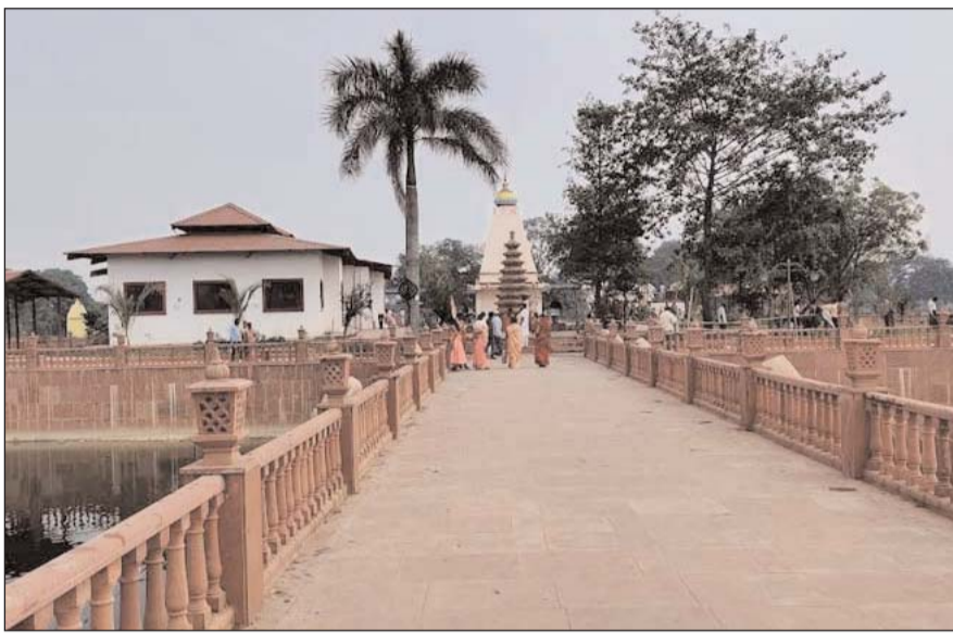
भी आधा हे ते पाय के लोगन मन फुटहा मंदिर भी बोले जाथे। सोमवंसी राजा हाथी म लाद के बड़े-

इतिहास के जानकार पोसन मारकंडे ह बताइस मंदिर छमासी रात के अधियार म बने हे अंजोर होय के सेती दिन म काम बंद कर दिस उही बखत ले मंदिर आधा अधूरा हे, तीन भाग म ऊपर भाग अभी