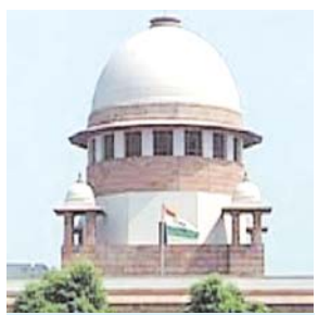
नफरती भाषण के दोषी पर कानूनी कार्रवाई हो, चाहे वह किसी भी पक्ष का हो : सुप्रीम कोर्ट

मॉडिया रिपोर्ट्स के मुताबिक, पिछली सुनवाई में हेट स्पीच और हेट क्राइम पर सुप्रीम कोर्ट ने सख्त विचार व्यक्त किए थे। सुप्रीम कोर्ट ने कहा था कि हेट क्राइम और हेट स्पीच पूरी तरह अस्वीकार्य है। भविष्य में ऐसी घटनाएं ना हों, मैकेनिज्म बनाना जरूरी है। हमें इस समस्या का हल निकालना होगा। सुप्रीम कोर्ट ने केंद्र से ऐसी घटनाओं को रोकने का प्रस्ताव मांगा था। सुप्रीम कोर्ट ने फिलहाल रैलियों आदि पर रोक लगाने के आदेश देने से इनकार किया था। कोर्ट ने याचिकाकर्ताओं से कहा है कि वे अपने पास उपलब्ध हेट स्पीच के मैटेरियल को तहसीन पूनावाला फेसले के मुताबिक नोडल अफसर को दें। नोडल अफसर कमेटी को इस तरह की शिकायतों पर निवारण के लिए समय समय पर मिलना चाहिए। साथ ही कहा था कि हम डीजीपी से कहेंगे कि वे एक कमेटी का गठन करें, जो अलग-अलग इलाकों के एसएचओ से प्राप्त हेट स्पीच की शिकायतों पर गौर कर उनके कंटेंट की जांच करे और सम्बंधित पुलिस अधिकारियों को इस बारे में निर्देश जारी करे।