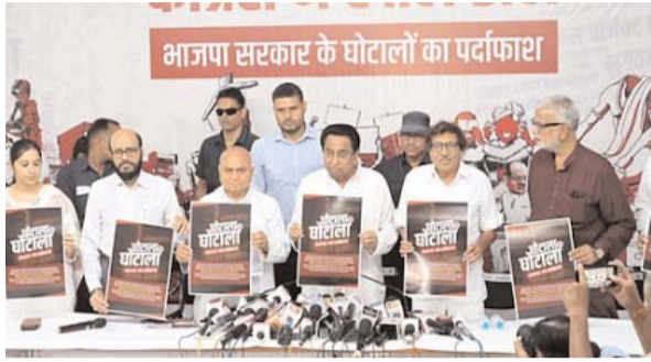
मध्य प्रदेश में विधानसभा चुनाव से पहले कांग्रेस आक्रामक

भोपाल, 18 अगस्त (एजेंसियां)। मध्य प्रदेश में विधानसभा चुनाव से पहले कांग्रेस आक्रामक है और सरकार पर हमलावर है। कांग्रेस प्रदेशाध्यक्ष कमलनाथ ने राज्य में तीन लाख करोड़ से ज्यादा के घोटाले होने के आरोप लगाए हैं। कमलनाथ ने घोटाला शीट जारी की और कहा कि वह समय दूर नहीं जब गूगल पर घोटाला सर्च किया जाएगा तो शिवराज सिंह चौहान की तस्वीर सामने आएगी। कांग्रेस प्रदेशाध्यक्ष कमलनाथ ने पार्टी कार्यालय में संवाददाताओं से चर्चा करते हुए कहा कि मध्यप्रदेश की शिवराज सिंह चौहान सरकार विश्व की सबसे अधिक घोटाला करने वाली सरकार है। शिवराज जी ने अपने 18 साल के कार्यकाल में घोटाले पर घोटाले कर भ्रष्टाचार का कीर्तमान रच दिया है। शिवराज सरकार के काले कारनामों का काला चिह्न बहुत लंबा है, जिनमें से कुछ महत्वपूर्ण महाघोटालों को शामिल कर कांग्रेस पार्टी ने शिवराज सरकार के 18 साल के कार्यकाल की घोटाला-शीट तैयार की है। इससे मध्य प्रदेश की जनता