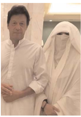
बुशरा बीबी ने पंजाब के गृह सचिव को लिखा पत्र

इस्लामाबाद, 19 अगस्त (एजेंसियां)। पाकिस्तान तहरीक-ए-इंसाफ (पीटीआई) के अध्यक्ष एवं पूर्व प्रधानमंत्री इमरान खान की पत्नी बुशरा बीबी ने जेल में बंद अपने पति की सुरक्षा को लेकर चिंता जताते हुए कहा है कि उनके पति को अटोक जेल में जहर दिया जा सकता है।