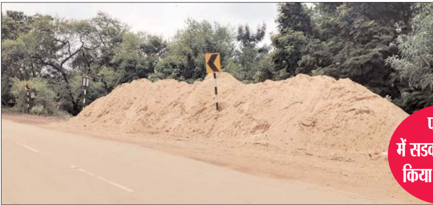
पामगढ़ में सड़क किनारे डंप किया जा रहा रेत

महानदी, हसदेव नदी के रेत घाट से ठेकेदारों के द्वारा दिन रात उत्खनन कर डंप किया जा रहा है। रात में भी उत्खनन और परिवहन का कार्य चल रहा है। रातभर रेत से भरी हाड़वा शहर और गांवों से होकर गुजर रही है। रातों रात ठेकेदार के द्वारा मशीन से खनन