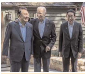
तीन देशों के बीच है पहली ऐसी साझेदारी

वाशिंगटन, 19 अगस्त (एजेंसियां)। उत्तर कोरिया और चीन से पैदा हुई सुरक्षा और आर्थिक चुनौतियों का सामना करने के लिए अमेरिका, दक्षिण कोरिया और जापान ने अपनी साझेदारी को नए स्तर पर ले जाने का फैसला किया है। आम खतरे की स्थिति में अमेरिका राष्ट्रपति जो बाइडेन, दक्षिण कोरिया के राष्ट्रपति यू सुक येओल और जापानी प्रधानमंत्री फुजियो किशिदा एक दूसरे से बात करने पर सहमत हुए। अमेरिका के मेरोलैंड में कैप डेविड प्रेसिडेंशियल रिट्रो में आयोजित एक त्रिपक्षीय शिखर सम्मेलन के दौरान तीनों नेता इस समझौते पर पहुंचे। इसे जापान, कोरिया गणराज्य और संयुक्त राज्य अमेरिका के बीच परामर्श करने की प्रतिबद्धता कहा गया। यह तीन देशों के बीच पहली ऐसी साझेदारी है। बयान में कहा गया, हम, जापान, कोरिया गणराज्य और संयुक्त राज्य अमेरिका के नेता, हमारी सरकारों को हमारे सामूहिक हितों को प्रभावित करने वाली क्षेत्रीय चुनौतियों, उकसावों और खतरे के