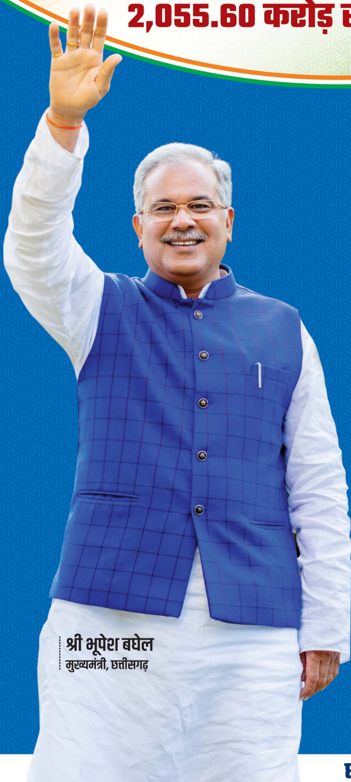
श्री भूपेश बघेल मुख्यमंत्री, छत्तीसगढ़

किसानों, मजदूरों, ग्रामीणों व पशुपालकों को न्याय की राशि 2,055.60 करोड़ रुपये का अंतरण