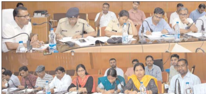
प्रास कर सत्यापन करें।

कलेक्टर ने कहा कि सभी अधिकारियों-कर्मचारियों को डाटा एण्ट्री सुनिश्चित करें। उन्होंने कहा कि निर्वाचन के लिए मानव संसाधन प्रबंधन, प्रशिक्षण, वाहनों की व्यवस्था, सफ्ट्वेयरइंजेशन, साइबर सिक्योरिटी, आईटी, स्वीप मतदाता जागरूकता कार्यक्रम, कानून एवं व्यवस्था, ईव्हीएम प्रबंधन, आदर्श आचार संहिता, निर्वाचन व्यव अनुवीक्षण, वीडियोग्राफी, कानून व्यवस्था के लिए गठित एमसीसी, मीडिया प्रमाण एवं पेड न्यूज निगरानी के लिए एमसीएमसी,