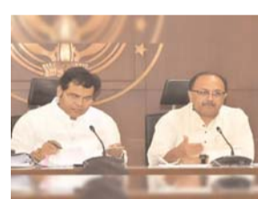
राजस्थान व छत्तीसगढ़ विस चुनाव को लेकर जताया दोनों नेताओं पर भरोसा