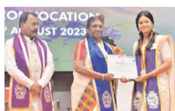
शिक्षण संस्थानों में कुत्रिम बुद्धिमत्ता, डेटा विज्ञान में विश्व स्तरीय क्षमता विकास कार्यक्रम : द्रौपदी मुर्मू

पणजी, 23 अगस्त (एजेंसियां)। दक्षिण अफ्रीका के पूर्व राष्ट्रपति नेल्सन मंडेला के कथन मुझे मेरी सफलताओं से मत आंकिए, मुझे इस आधार पर आंकिए कि मैं कितनी बार गिरा और फिर खड़ा हुआ का हवाला देते हुए राष्ट्रपति द्रौपदी मुर्मू ने बुधवार को युवाओं को सलाह दी कि परिस्थितियां कैसी भी हों, कभी हार नहीं माननी चाहिए। मुर्मू गोवा की तीन दिवसीय यात्रा पर हैं, जो मंगलवार से शुरू हुईं। उन्होंने राजभवन में गोवा विश्वविद्यालय के 34वें दीक्षांत समारोह को संबोधित किया। नेल्सन मंडेला के कथन का जिक्र करते हुए मुर्मू ने कहा, आज आपने जो डिग्रियां और स्वर्ण पदक अर्जित किए हैं, वे आपको नौकरी पाने या बिजनेस शुरू करने में मदद करेंगे। लेकिन, एक क्वालिटी, जो आपको बहुत आगे ले जा सकती है, वह है जीवन में कभी हार न मानने का साहस। परिस्थितियां कैसी भी हों, कभी हार नहीं माननी चाहिए। राष्ट्रपति ने जोर देकर कहा कि देश के उच्च शिक्षण