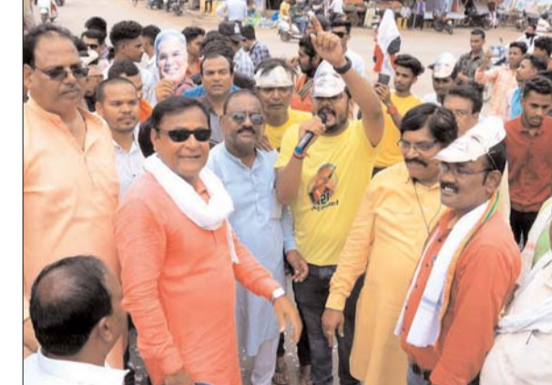
तत्पश्चात नैला स्थित श्रीकृष्ण गौशाला में गौ माताओं को गुड़, चना और केला खिलाकर आशीर्वाद प्राप्त किया। अंत में सैकड़ों की तादाद में उपस्थित वरिष्ठ कांग्रेसजन एवं युवा कांग्रेस