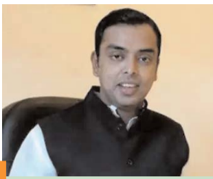
हर बैठक के साथ आगे बढ़ने की कार्य योजना होती जा रही और दुरुस्त : मिलिंद देवड़ा

नई दिल्ली, 27 अगस्त (एजेंसियां)। कांग्रेस नेता मिलिंद देवड़ा ने मुंबई में विपक्षी गठबंधन 'इंडिया' (इंडियन नेशनल डेवलपमेंटल इन्क्यूसिव अलायंस) की अहम बैठक से पहले रविवार को कहा कि 2024 में होने वाले लोकसभा चुनाव के लिए गठबंधन साझेदारों के बीच सीट बंटवारे को कई राज्यों में कमोबेश अंतिम रूप दे दिया गया है, केवल कुछ राज्यों में ही थोड़े अधिक समय की आवश्यकता है। देवड़ा ने कहा कि विपक्षी गठबंधन की हर बैठक समान रूप से महत्वपूर्ण है। पूर्व केंद्रीय मंत्री ने कहा कि हर बैठक के साथ आगे बढ़ने की कार्य योजना और दुरुस्त होती जा रही है। मैं मुंबई में बैठक आयोजित करने में व्यक्तिगत रूप से मदद कर रहा हूँ और मैं इसकी सफलता को लेकर बहुत आशावादी हूँ। बैठक के आयोजन में अहम भूमिका निभा रहे देवड़ा ने 'इंडिया' के साझेदारों के बीच क्विडिंग करते रहे तालमेल' की भी सराहना की और कहा कि इसका सबसे अच्छा उदाहरण महाराष्ट्र में देखने को मिलता है। 'इंडिया' गठबंधन की बैठक 31 अगस्त-एक सितंबर को होनी है। महाराष्ट्र कांग्रेस के नेता देवड़ा ने कहा कि राज्य में कांग्रेस, राष्ट्रवादी कांग्रेस पार्टी (एनसीपी) और शिवसेना (उद्धव बालासाहेब ठाकरे) के महा विकास