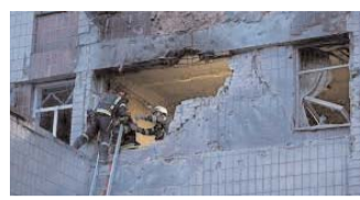
प्रारंभिक जानकारी के अनुसार, कुर्स्क में काल् मार्क्स स्ट्रीट पर एक अपार्टमेंट इमारत में रात में एक ड्रोन दुर्घटनाग्रस्त हो गया। कुछ मंजिलों पर खिड़कियां उड़ गईं। विस्फोट की लहर ने पास के कुर्स्क राज्य कृषि अकादमी के इंजीनियरिंग संकाय की इमारत में कई खिड़कियों को भी क्षतिग्रस्त कर दिया।