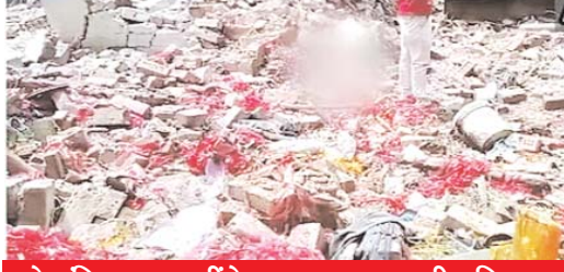
दो मंजिला घर जर्मिंदोज, अन्य आवास भी क्षतिग्रस्त

कोलकाता, 27 अगस्त (एजेंसियां)। पश्चिम बंगाल में उत्तर 24 परगना जिले के दत्तपुकुर में रविवार को एक अवैध पटाखा फैक्ट्री में विस्फोट होने से कम से कम 8 लोगों की जलकर मौत हो गई, जबकि कुछ अन्य बुरी तरह घुलस गए। आधिकारिक सूत्रों के मुताबिक विस्फोट सुबह करीब साढ़े दस बजे दत्तपुकुर थाना क्षेत्र के नीलगंज-मोशपोल के आवासीय इलाके में हुआ। विस्फोट से घर में आग लग गई। वहीं बुरी तरह घुलस लोगों को इलाज के लिए बरसात अस्पताल में भर्ती कराया गया। विस्फोट