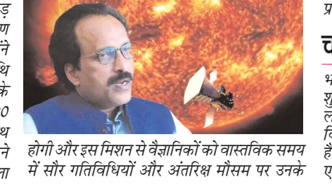
होगी और इस मिशन से वैज्ञानिकों को वास्तविक समय में सौर गतिविधियों और अंतरिक्ष मौसम पर उनके

प्रभाव का अध्ययन करने में मदद मिलेगी। चंद्र सतह पर मापा गया तापमान भारत के चंद्रयान-3 ने चांद के बारे में जानकारी देना शुरू कर दिया है। विक्रम लैंड और रोवर प्रज्ञान पर लगे सभी उपकरण ठीक से काम कर रहे हैं। लैंड विक्रम ने चंद्रमा की सतह के तापमान का पता लगाया है। भारतीय अंतरिक्ष अनुसंधान संगठन ने यह अपडेट एक्स पर शेयर किया।