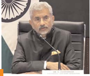
अगर कम विकसित देशों की चिंताएं दूर नहीं होंगी, तो यह आगे नहीं बढ़ सकता है: एस. जयशंकर, विदेश मंत्री

नई दिल्ली, 27 अगस्त (एजेंसियां)। विदेश मंत्री एस. जयशंकर ने ग्लोबल साउथ (कम विकसित) देशों पर ध्यान आकर्षित करते हुए कहा कि जी20 का मुख्य उद्देश्य आर्थिक वृद्धि और विकास