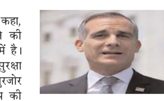
हमें इस मुद्दे पर एकजुट होना होगा। मुझे लगता है कि जी-20 के बाद अधिक देर देखेंगे कि भारत का नेतृत्व किसना महत्वपूर्ण है, और मुझे आशा है कि इससे भारत को अधिक समर्थकों को जुटाने के अभियान में मदद मिलेगी और जल्द ही एक दिन अंततः हम इसे साकार होते देखेंगे। यह पूछे जाने पर कि वह भारत की जी-20 अध्यक्षता को किस प्रकार देखते हैं, श्री गारसेटी ने कहा, यह आश्चर्यजनक रहा है। मैं बहुत प्रभावित हुआ हूँ। मुझे विभिन्न शहरों में प्रेरणा मिली है। मैं भौगोलिक विस्तार से प्रभावित हूँ,

नई दिल्ली, 27 अगस्त (एजेंसियां)। भारत में अमेरिका के राजदूत एरिक गारसेटी ने कहा है कि उनका देश भारत की संयुक्त राष्ट्र सुरक्षा परिषद के विस्तार की मांग का पुरजोर समर्थन करता है। श्री गारसेटी ने एक साक्षात्कार में कहा कि समय की मांगों को पूरा करने के लिए संस्थानों के विस्तार आवश्यकता है। इस सवाल पर कि भारत के संयुक्त राष्ट्र सुरक्षा परिषद (यूएनएससी) की स्थायी सदस्यता में क्या बाधाएं हैं और भारत कब तक इसका सदस्य बन सकता है,