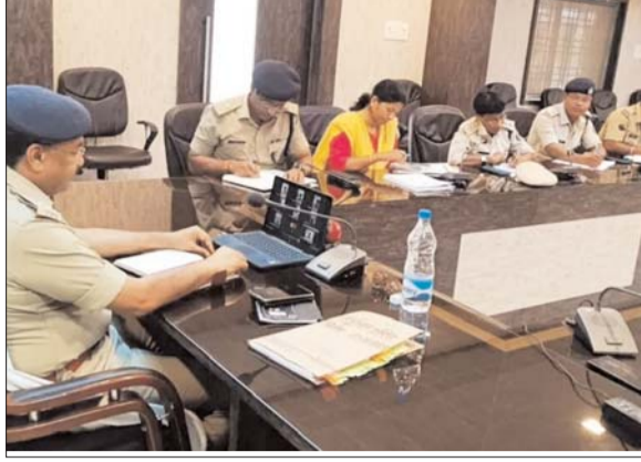
निर्देशित किया गया। पुलिस अधीक्षक द्वारा मिटिंग में गंभीर अपराधों एवं महिला संबंधित अपराधों के फरार आरोपियों को

जांजगीर, 27 अगस्त (देशबन्धु)। आगामी विधान सभा चुनाव व्यवस्था को देखते हुये समीक्षा मिटिंग पुलिस अधीक्षक कार्यालय में ली गई। जिसमें जिले के राजपत्रित अधिकारी, थाना, चौकी प्रभारी उपस्थित रहे। संवेदनशील मतदान केन्द्र एवं थाना क्षेत्र अंतर्गत मतदान केन्द्रों की जानकारी लेने के संबंध में थाना प्रभारी को