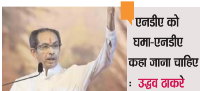
एनडीए की घमा-एनडीए कहा जाना चाहिए : उद्धव ठाकरे

माप नहीं है। विपक्षी गठबंधन इंडिया को चर्माडिया (अहंकारी) और इंडियन मुजाहिदीन कहने के लिए प्रधानमंत्री नरेंद्र मोदी पर निशाना सहते हुए ठाकरे ने कहा कि एनडीए को घमा-एनडीए कहा जाना चाहिए। महाराष्ट्र के हिंगोली में एक रैली को संबोधित करते हुए उन्होंने तेलंगाना के मुख्यमंत्री और भारत राष्ट्र समिति (बीआरएस) प्रमुख के. चंद्रशेखर राव से यह स्पष्ट करने के लिए कहा कि वह इंडिया गठबंधन का समर्थन कर रहे हैं या भारतीय जनता पार्टी (भाजपा) का समर्थन कर रहे हैं। महाराष्ट्र में चुनावी राजनीति में प्रवेश करने की कोशिश कर रहे बीआरएस का जिक्र करते हुए ठाकरे ने कहा यदि आप देश के साथ हैं, तो इंडिया गठबंधन में शामिल हों या खुले तौर पर भाजपा के