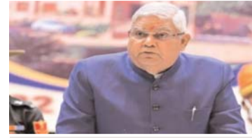
उपराष्ट्रपति ने सैनिक स्कूल में विद्यार्थियों को किया संबोधित

झुंझुनू, 27 अगस्त (एजेंसियां)। उपराष्ट्रपति जगदीप धनखड़ ने कहा है कि फेल होने का डर अपनी ताकत को कम करता है। इसलिए असफलता का भय नहीं रखना चाहिए। धनखड़ आज झुंझुनू जिले के दोरासर स्थित सैनिक स्कूल में विद्यार्थियों को संबोधित कर रहे थे। उन्होंने कहा कि आप जिस भी क्षेत्र में अभिरुचि रखते हैं उसमें खुल कर आगे बढ़ें। उपराष्ट्रपति जगदीप धनखड़ ने अपने छात्र जीवन को याद करते हुए कहा कि वह हमेशा अपनी कक्षा में प्रथम आते थे, उन्हें डर लगने लगा था कि यदि वे प्रथम नहीं आए, तो क्या होगा। आज सोचते हैं कि प्रथम नहीं आकर दूसरे, तीसरे या चौथे स्थान पर भी रहते, तो भी ज्यादा फर्क नहीं पड़ता। उन्होंने कहा कि वह झुंझुनू सैनिक स्कूल के विद्यार्थियों के बैच को राज्यसभा की कार्यवाही को देखने के लिए बुलाएंगे। धनखड़ ने विद्यार्थियों से कहा कि आप देश का भविष्य हैं। सैनिक स्कूल से जो भी विद्यार्थी निकलता है वो चाहे किसी भी क्षेत्र में जाए अच्छा ही करता है। उन्होंने कहा कि आज झुंझुनू सैनिक स्कूल में आने पर उन्हें