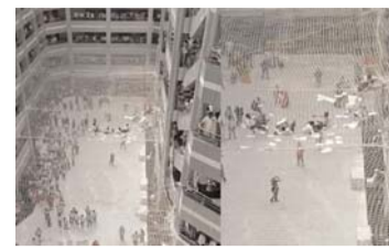
■ मंत्रालय के अंदर सुरक्षा जाल पर कूदे पीडब्ल्यूडी मंत्री का घेराव करने का किया प्रयास

मुंबई, 29 अगस्त (एजेंसियां)। वधा के सैकड़ों किसान अपनी लंबे समय से लंबित मांगों को लेकर राज्य सरकार के खिलाफ विरोध-प्रदर्शन कर रहे हैं। विरोध-प्रदर्शन के दौरान कई किसान मंगलवार को लंबित मांगों पर दबाव बनाने के लिए राज्य सरकार के मुख्यालय, मंत्रालय के प्रतीक्षा कक्ष में लगाए गए भारी सुरक्षा जालों पर कूद गए। किसान कथित तौर पर वहां स्थापित एक चिकित्सा शिविर में भाग लेने के लिए छोटे समूहों में मंत्रालय के अंदर आए थे। लेकिन अचानक उन्होंने सरकार के खिलाफ नारे लगाने शुरू कर दिए और पीडब्ल्यूडी मंत्री दादा भुसे का घेराव करने की कोशिश की और फिर सुरक्षा जाल पर कूद गए। किसानों ने अपर वर्धा एक्शन कमेटी लिखे काले पोस्टर भी लहराए और कहा कि बार-बार याद दिलाने के बावजूद उनकी मांगों नहीं मानी गईं। किसान नेताओं ने दावा किया कि कई किसानों ने लगभग चार महीने पहले प्रस्तावित ऊपरी वर्धा बांध परियोजना के