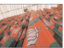
■ मध्य प्रदेश में साल के अंत तक होने हैं विधानसभा चुनाव

भाजपा ने इस बार एक तरफ जहां मुख्यमंत्री शिवराज सिंह चौहान के अलावा अन्य दिग्गज नेताओं को भी चुनाव प्रचार अभियान में आगे रखा है तो वहीं अब एंटी इनकॉर्सेंसि के माहौल को कमजोर करने के लिए पार्टी ने अपने 40 से ज्यादा वर्तमान विधायकों का टिकट काटने की भी तैयारी कर ली है। भाजपा सूत्रों के मुताबिक, पार्टी ने राज्य के एक-एक विधान सभा सीट पर जीत हार के समीकरण को लेकर और वर्तमान विधायकों की