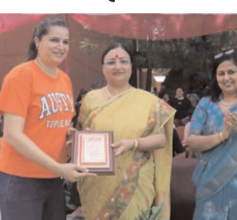
दिल्ली विवि के मैत्रेयी कॉलेज में होगा राष्ट्रीय खेल दिवस का आयोजन विभिन्न खेलों की दिग्गज खेल हस्तियों को किया जाएगा याद