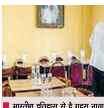
भारतीय इतिहास से है गहरा नाता

इस ऐतिहासिक बैठक स्थल और भोजनालय को बंद किए जाने की घोषणा सोमवार को की गई। इस क्लब को बंद करने के खिलाफ काफी लंबी लड़ाई लड़ी गई, जिसमें समर्थकों की हार के बाद इसे बंद करने की घोषणा हुई। इंडिया क्लब ऐतिहासिक बिल्डिंग लंदन के स्टूड के मध्य में स्थित है। बिल्डिंग को तोड़कर कर यहां एक