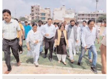
दिल्ली को साफ सुथरा बनाने के लिए जरूरत पड़ने पर सख्त कदम भी उठाएंगे एसआई समेत तीन सफाई कर्मचारियों को किया निलंबित

नहीं किया जाएगा। दिल्ली को साफ सुथरा बनाने के लिए जरूरत पड़ने पर सख्त कदम भी उठाएंगे। सीएम अरविंद केजरीवाल के नेतृत्व में दिल्ली को दुनिया का सबसे बेहतरीन शहर बनाने के लिए प्रतिबद्ध हैं। क्षेत्र में सफाई व्यवस्था सुनिश्चित करने हेतु अतिरिक्त ऑटो टिम्पर लायगे जाएं। छोटी गलियों की साफ-सफाई पर विशेष ध्यान दिया जाए।