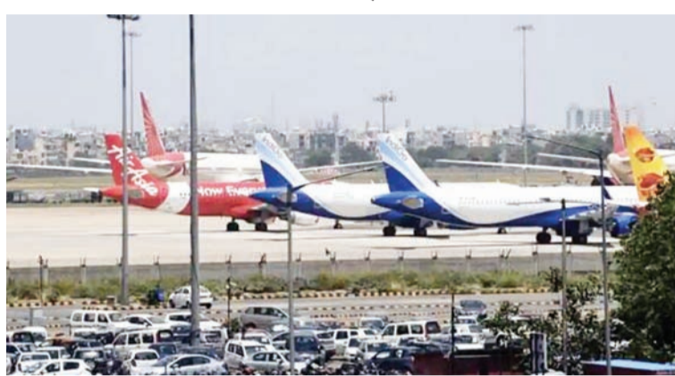
नागरिक उड्डयन मंत्रालय मेहमानों की आवाजाही की तैयारियों को अंतिम रूप देने में जुटा

जोगेन्द्र सोलंकी नई दिल्ली, 26 अगस्त (देशबन्धु)। जी-20 शिखर सम्मेलन के आयोजन को लेकर दिल्ली में जोर शोर से की जा रही तैयारियों के बीच दिल्ली एयरपोर्ट पर एक हजार से अधिक फ्लाइटों को कैंसिल किए जाने की संभावना है। इसके चलते बाहर से आने व दिल्ली से वाले हवाई यात्रियों को भारी परेशानी का सामना करना पड़ सकता है। नागरिक उड्डयन मंत्रालय वीवीआईपी मेहमानों की आवाजाही को लेकर दिल्ली एयरपोर्ट पर तैयारियों को अंतिम रूप देने में जुटा है। सम्मेलन के दौरान दिल्ली एयरपोर्ट अच्छी खासी चहल पहल देखने को मिल सकती है। एयरपोर्ट पर वीवीआईपी मेहमानों की आवाजाही के कारण सुरक्षा के मद्देनजर एक हजार से अधिक फ्लाइटों को कैंसिल किए जाने की संभावना है। विमान मंत्रालय की एक रिपोर्ट में ये जानकारी साझा की गई है। एयरपोर्ट पर पार्किंग की व्यवस्था अच्छी रहे इसलिए जी-20 शिखर सम्मेलन के दौरान 1000 फ्लाइटों को कैंसिल किया जा सकता है।