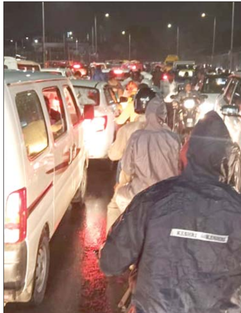
चौबीस घंटे में बारिश का आंकड़ा 30 इंच के पास पहुंचा

जबलपुर, देशबन्धु। प्रदेश के साथ जबलपुर में मानसून सक्रिय है। इसका प्रभाव देखने को मिल रहा है। मंगलवार की शाम से शुरू हुई बारिश बुधवार को भी जारी रही। हालांकि दोपहर बाद बारिश रुक-रुक कर हो रही थी। बारिश का आंकड़ा 30 इंच के करीब पहुंच गया है। इस लिहाज से कहा जा सकता है कि जबलपुर में औसतन 50 से 55 इंच इंच होने वाली आधे से ज्यादा बारिश हो गई है जो सभी के लिये अच्छी खबर मानी जा सकती है। इस बीच पारा दिन और रात का कम हो गया है। इससे उमस भरी गर्मी से लोगों को निजात मिली है। अगले चौबीस घंटे में