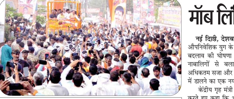
भिंड में जनदर्शन कार्यक्रम में मुख्यमंत्री शिवराज सिंह चौहान के स्वागत में उमड़ी भीड़ ने कदम-कदम पर अभिनंदन किया और फूल बरसाये।