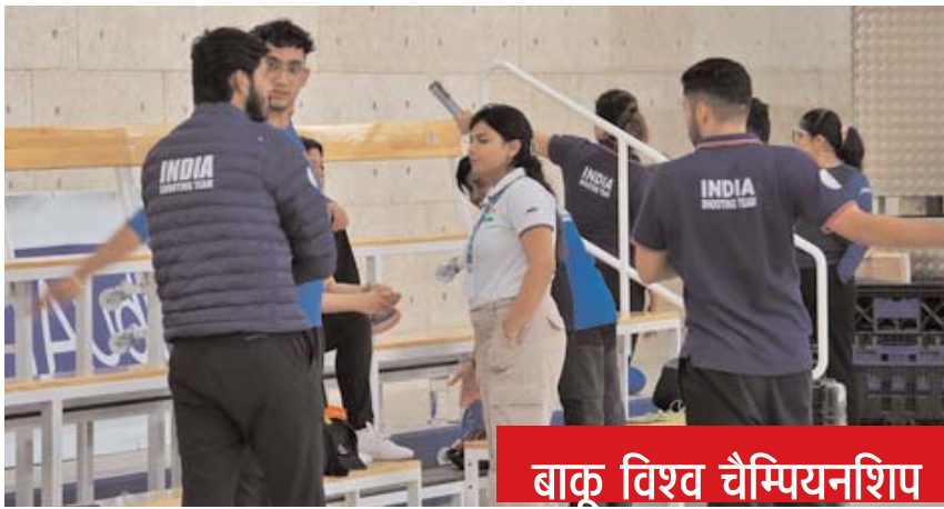
बाकू विश्व चैम्पियनशिप

नई दिल्ली, 14 अगस्त (एजेंसियां)। भारतीय राष्ट्रीय शूटिंग टीम ने ब्यू-रिबैंड इवेंट, इंटरनेशनल शूटिंग स्पोर्ट फेडरेशन (आईएसएसएफ) वर्ल्ड चैम्पियनशिप ऑल इवेंट्स में अपना अभियान शुरू किया, जो आधिकारिक तौर पर सोमवार को अज़रबैजान के बाकू में शुरू हुआ और 1 सितंबर तक चलेगा। पेरिस ओलंपिक को ध्यान में रखते हुए बाकू विश्व चैम्पियनशिप में भारतीय शूटर्स अपना अभियान शुरू करने के लिए तैयार हैं। 53 सदस्यीय भारतीय दल में से 34 निशानेबाज 15 ओलंपिक स्पर्धाओं में भाग लेंगे जबकि 19 गैर-ओलंपिक स्पर्धाओं में प्रतिस्पर्धा करेंगे। शूटिंग विभागीय द्वारा इस चैम्पियनशिप को ओलंपिक के