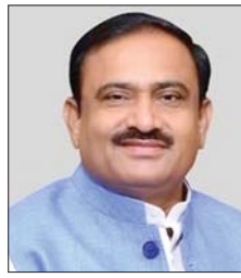
ध्वजारोहण करेंगे। जिसके लिये जरूरी तैयारियों को कर लिया गया है। तय समय पर झंडा वंदन होगा। इसमें न्यायाधीश एवं