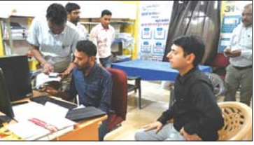
अधीक्षक से छात्रावास से चालन से संबंधित विषयों पर