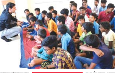
प्रशासन गरियाबंद द्वारा बोलेगा बचपन का आयोजन प्रारंभ किया गया। इस अवसर पर कलेक्टर ने बच्चों के अतिरिक्त स्कूल जाने वाले विद्यार्थियों से प्रतिदिन दो-दो विद्यार्थियों द्वारा अपना