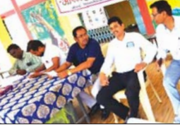
कराया जा सकता है ताकि विकास खंड के कक्षा पहिले से बारहवी तक के संस्तर दिव्यांग छात्रों को उपरका पूर्ण ताला दिलवाया जा सके। इस शिविर में विकास खंड तिलवा 142 विद्यार्थियों को भागीदारी हुए निम्न खंडरतों

खोरग, 13 अप्रैल (देशबन्धु)। प्रति वर्ष को प्रति दिन एवं भी समाज शिक्षा के तहत विकास खंड शिक्षा कार्यालय तथा विकास खंड स्तरीय समन्वयक कार्यालय तिलवा की ओर से शासकीय उच्च प्राथमिक शाला बंगोली स्वस्थ एवं आकेशन शिविर का आयोजन किया गया। इस शिविर का शुभारंभ भी आर सी श्री स्तरीय शर्मा एवं प्रभु पाठक श्री किशोर कोरवार के द्वारा मंच सारने से हुआ अर्थात् का सा किया गया। इस अवसर पर उपस्थित शिक्षक, पालक एवं प्रिया जनी को उपस्थित करने बालक भी था गया।