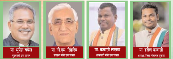
मा. भूपेश बबेल मुख्यमंत्री छग शासन

चिनीत : समस्त जनपद सदस्य जनपद पंचायत दन्तेवाड़ा, जिला-दन्तेवाड़ा