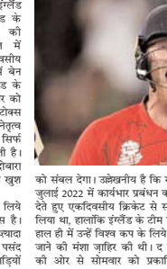
अगर बड़े मौकों के लिये कोई खिलाड़ी है, तो वह बेन स्टोक्स है। इंग्लैंड के लिए उनकी वापसी से उद्घाटन प्रवेश होगा।