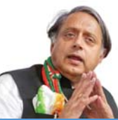
महाराष्ट्र की 20 वीं वीथी का निर्माण करने के लिए...