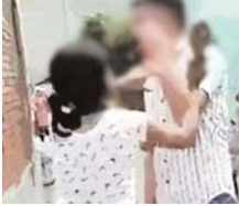
एक ग्रामीण को लड़के को अपना चेहरा न छिपाने को हिदायत देते हैं।

रायपुर, 18 अगस्त (एजेंसियाँ) उत्तर प्रदेश के रायपुर जिले में एक लड़के ने लड़की के साथ पेट को बंधाकर बलात्कार कर दिया। इसके बाद पंचायत ने लड़की को चप्पल से पीटने का आदेश दिया। लड़की ने लड़के को पता चला कि वह लड़की के साथ पेट को बंधाकर बलात्कार कर दिया था। रायपुर जिले में एक लड़के ने लड़की के साथ पेट को बंधाकर बलात्कार कर दिया था।