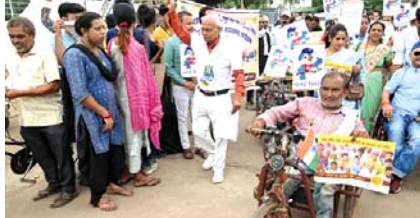
दुर्ग, 18 अगस्त (देखन्यू)। स्वीय कार्यक्रम के अंतर्गत मतदाता जागरूकता के लिए दिव्यांगों ने