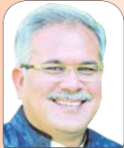
मा. भूरेश बचेल मुख्यमंत्री