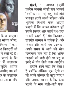
शीम सांग रिलीज किया जाएगा।

नोएडा, 18 अगस्त (एजेंसियाँ) पाकिस्तानी महिला साया हिराज का नाम फिल्मों में रिलीज कर दिया गया है। एक फिल्म को रिलीज करने के लिए साया हिराज को नोएडा में रखा गया है।