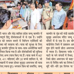
उत्तरी भारत और कई शांति प्रदेश यज् कश्मीर में मालवपुर हिंदू विधवाओं में से एक है।

जम्मू, 18 अगस्त (देवभार) प्रदेश में इस समय कई अमरनाथ यात्रा चल रही है। इस कश्मीर में पिछले 50 दिनों से जारी अमरनाथ यात्रा का अंतिम चरण आज से शुरू करने की तैयारी की जा रही है।