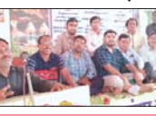
राजिम में छत्तीसगढ़ी भाषा पर हुई साहित्यिक संगोष्ठी विद्वानों ने रखे अपने विचार