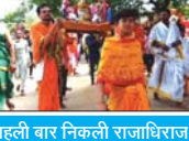
पहली बार निकली राजाधिराज श्री गंधेश महाप्राण की पाकरी

महासमूह, 28 अगस्त (देखबन्यू)। सावन के अंतिम सोमवार को लेकर जलौलीकों में 'बादा' उत्सव रहा। वहीं दर्शनार्थी भी परिवार समेत शिव मंदिरों में खिंचे चले आ रहे थे। यह-देवांगन और सोमवार को देखने को मिला। अंतिम सावन सोमवार के कारण नगर के आसपास दलदली कनेचरों बढनी में सुबह से ही पुजन अर्चना के लिए भक्त पहुंचते रहे। बढनी में 5 बजे दूध चने बहनकर नाथ का दुर्धाराभिषेक किया गया। अभिषेक से शामिल होने काने संख्या में ब्रह्मदत्त मोलेनार को पालकी काया निकाली गई जिसके लिए पहुंचे थे। वहीं सिरपूर स्थित गंधेश महादेव में प्रातः कावे संख्या में आसपास के >>> शेष पृष्ठ 9 पर