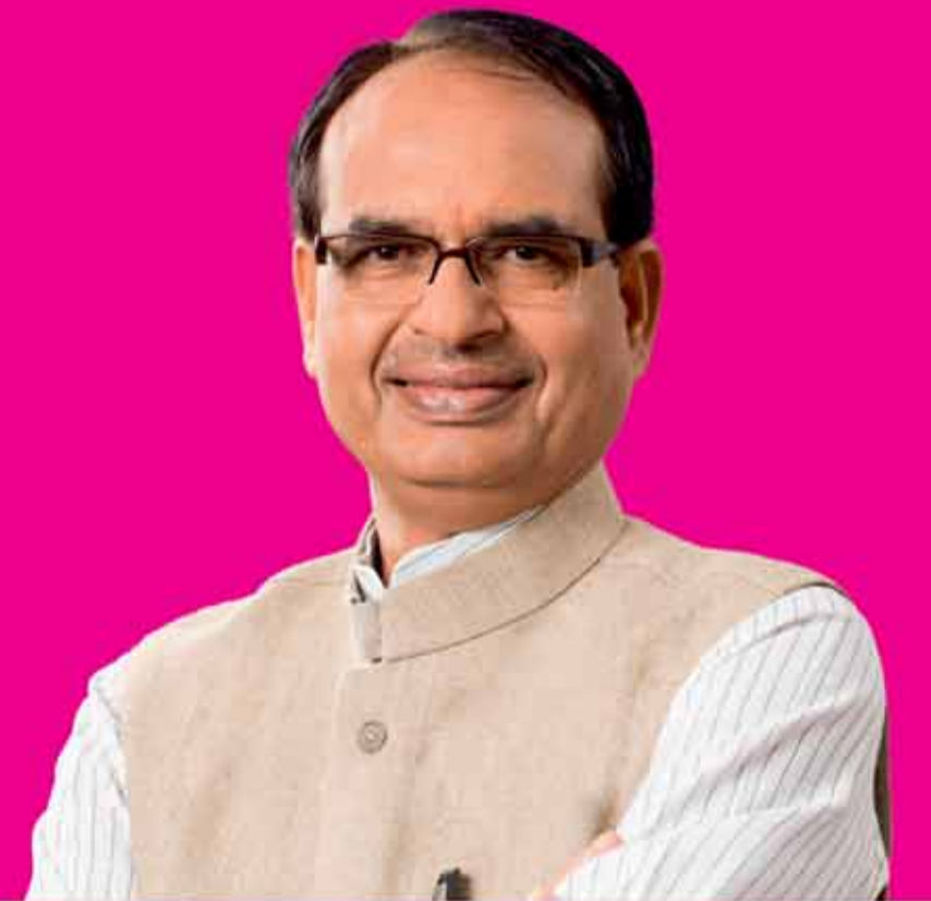
शिवराज सिंह चौहान, मुख्यमंत्री

पिछले दो महीने में बहनों को मिले ₹2419 करोड़ से अधिक