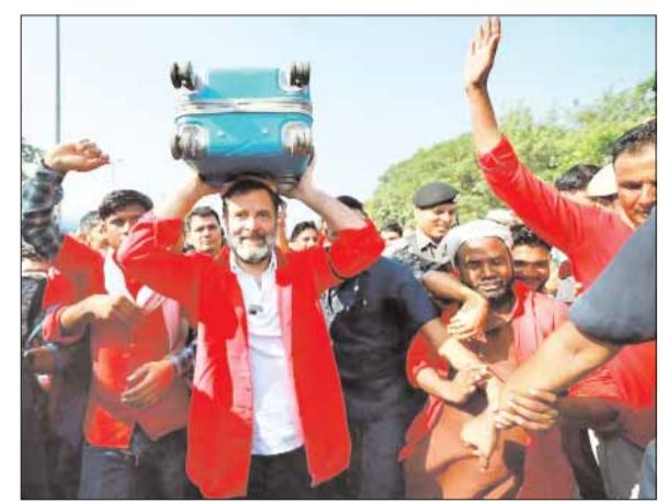
सिर पर सामान उठाया, पोशाक भी पहनी

नई दिल्ली, देशबन्धु। कांग्रेस के पूर्व अध्यक्ष राहुल गांधी ने गुरुवार को यहां एक रेलवे स्टेशन का दौरा कर और कुलियों से बातचीत कर उनकी समस्याओं पर बात कर एक बार फिर लोगों को चौंका दिया। यहां उन्होंने कुली की लाल यूनिफॉर्म पहनी और बैज भी लगाया। इसके बाद उन्होंने सिर पर सामान उठाया। इस दौरान उनके साथ मौजूद कुली राहुल गांधी जिंदाबाद के नारे लगाते नजर आए।