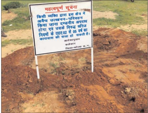
छत्तीसगढ़ बिलासपुर के समक्ष दायर याचिका क्रमांक डब्ल्यूपी (पीआईएल) नं. 66 /2023 तथा

अवैध उत्खनन और परिवहन वाले मार्गों को किया गया है अवरुद्ध