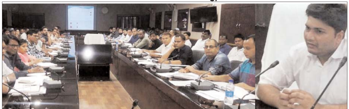
ग्राम पंचायतों में 13 सितंबर स 15 सितंबर तक आयोजित हो रही विशेष ग्रामसभा में प्रधानमंत्री आवास ग्रामीण योजना के पात्र-अपात्र हितग्राहियों की सूची प्रस्तावित करने के निर्देश दिए हैं।

सीईओ ने ईई आरईएस, एसडीओ, सब इंजीनियर तकनीकी सहायकों को निर्देश दिए कि सभी तकनीकी अमला प्रतिदिन पंचायतों का भ्रमण करके कार्यों निरीक्षण, मूल्यांकन करें और निर्माण कार्य शीघ्र पूर्ण कराये। उन्होंने उपस्थित अधिकारियों को निर्देशित किया कि