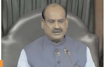
नाए संसद भवन में नई ऊंचाइयां प्राप्त करेगा देश का लोकतंत्र : ओम बिरला

नई दिल्ली, 18 सितम्बर (देशबन्धु)। संसद के विशेष सत्र के पहले दिन लोकसभा अध्यक्ष ओम बिरला ने संदन को सम्बोधित करते हुए कहा कि संदन संवाद संस्कृति का जीवंत प्रतीक है। उन्होंने कहा कि विभिन्न दलों के बीच सहमति-असहमति के बीच पिछले 75 वर्षों में देशहित में सामूहिकता से निर्णय लिए गए तथा संसदीय विचार-विमर्श की पद्धति से देश की जनता के जीवन में सामाजिक आर्थिक बदलाव के लिए कानून बनाए गए। उन्होंने गर्व व्यक्त