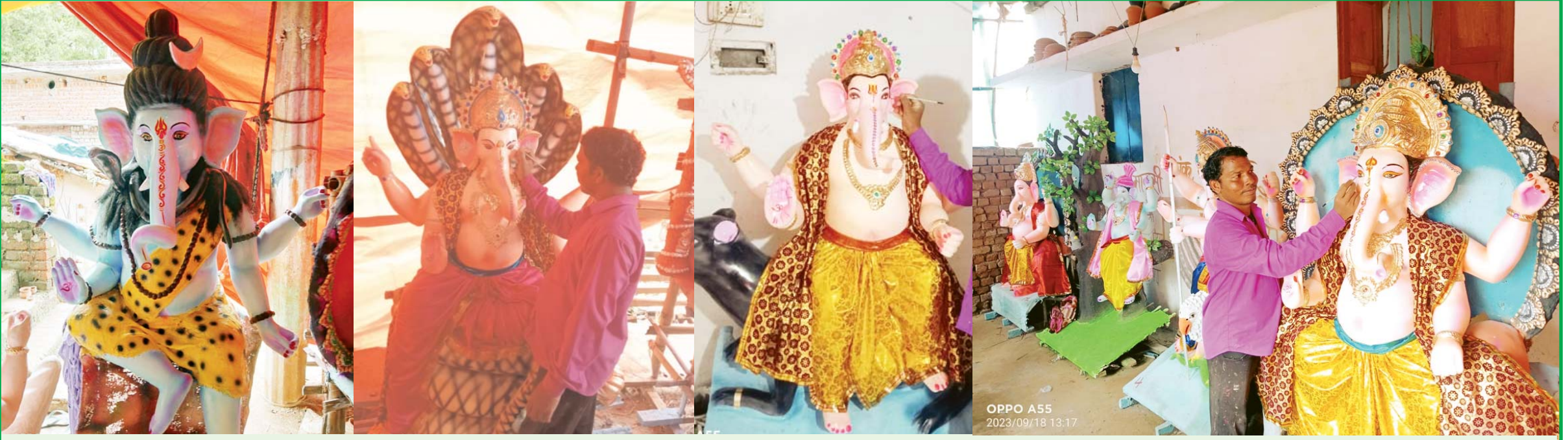
बिलासपुर। गणेश पूजा आज से। शहर में जगह-जगह भगवान गणेश की मूर्ति विराजेगी, बाजारों में आज प्रतिमा की खरीदारी करने भारी संख्या में लोग उमड़े।