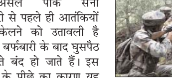
एलओसी पर सभी लूप होलों को बंद करने की कोशिश की जा रही है

दरअसल पाक सेना बर्फबारी से पहले ही आतंकियों को उठावली है क्योंकि बर्फबारी के बाद घुसपैठ के रास्ते बंद हो जाते हैं। इस दृष्टिकोण से घेरे का कारण यह बताया जा रहा है कि पाक सेना एक बार फिर घुसपैठ के लिए कवर फायर की नीति अपनाते लगी है। यह उड़ी में दो दिन पहले साफ हो चुका है। हालांकि इसके प्रति सिर्फ अनुमान ही है कि एलओसी के पार पाक कब्जे वाले कश्मीर में चल रहे