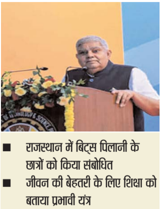
राजस्थान में बिट्स पिलानी के छात्रों को बिट्स संबोधित जीवन की बेहतर के लिए शिक्षा को बताया प्रभावी यंत्र

नई दिल्ली , 27 सितम्बर (एजेंसियाँ)। उपराष्ट्रपति जगदीप धनखड़ ने नारी शक्ति वंदन अधिनियम को एक युगांतकारी करार देते हुए बुधवार को कहा कि जब तक 50 प्रतिशत मानवता के लिए एमपी सुनिश्चित नहीं किया जाता तब तक समाज का विकास नहीं हो सकता। धनखड़ ने बुधवार को राजस्थान में बिरला इंस्टीट्यूट ऑफ टेक्नोलॉजी एंड साइंस (बिट्स) पिलानी के छात्रों और संकाय सदस्यों को संबोधित करते हुए यह बात कही। उन्होंने महिलाओं को विधानसभाओं और लोकसभा में एक तिहाई आरक्षण देने के विधेयक का उल्लेख करते हुए कहा कि यह महिलाओं के अधिकारों की मान्यता और उनके अधिकार की पुष्टि है। उपराष्ट्रपति जगदीप धनखड़ ने आम जनता के जीवन को बेहतर बनाने के लिए शिक्षा को सबसे प्रभावी और प्रभावशाली यंत्र बताया और कहा कि इससे भारत के विकास में तेजी आएगी।