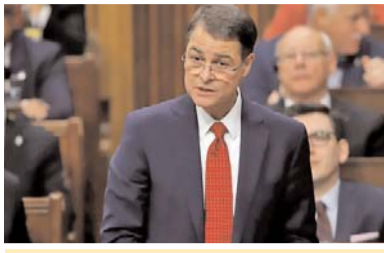
■ सभी दलों के नेताओं के साथ बैठक के बाद पद छोड़ने की घोषणा की

ओटावा, 27 सितम्बर (एजेंसियां)। एंथनी रोटा ने द्वितीय विश्व युद्ध के दौरान नाजी इकाई के लिए लड़ने वाले एक व्यक्ति को निर्मात्रण दिए जाने और बाद में सदन द्वारा उसे सम्मानित किए जाने पर कनाडाई संसद के अध्यक्ष पद से इस्तीफा दे दिया है। सीटीवी न्यूज की रिपोर्ट के अनुसार, रोटा ने मंगलवार दोपहर पार्लियामेंट हिल में सदन में सभी दलों के नेताओं के साथ बैठक के बाद पद छोड़ने के अपने अभूतपूर्व निर्णय की घोषणा की। सभी पार्टियों के सांसदों की ओर से सम्मानजनक काम करने और अध्यक्ष की कुर्सी छोड़ने के लिए लगातार बढ़ते दबाव के बीच उन्होंने यह कदम उठाया है। रोटा ने कहा, इस सदन का काम हममें से किसी से भी ऊपर है। इसलिए, मुझे आपके अध्यक्ष पद से हट जाना