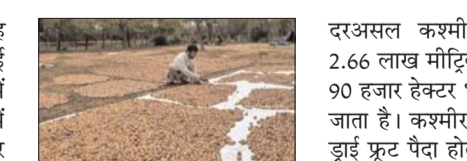
कश्मीर में जितना भी झाड़ फूट पैदा होता है उसमें 98 प्रतिशत स्थान अखरोट का है

सुदेश एस डुंगर जम्मू , 27 सितम्बर (देशबन्धु)। यह जानकर आप हैरान होंगे की कश्मीर में पेड़ भी कश्मीरियों की जानें ले रहे हैं। यह सच है कि अखरोट के पेड़ अक्सर जानलेवा बन जाते हैं और उन पर चढ़ने वाले कश्मीरी जमीन पर गिर कर जान गंवा दे रहे हैं। आज भी अनंतनाग में एक कश्मीरी।