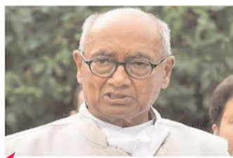
धोखेबाजों को जनता देगी धोखा : दिग्विजय सिंह

उज्जैन , 27 सितम्बर (एजेंसियाँ)। मध्यप्रदेश के पूर्व मुख्यमंत्री दिग्विजय सिंह ने ज्योतिरादित्य सिंधिया पर हमला बोलाते हुए कहा कि जो बिकने वाले थे बिक गए अब कांग्रेस में बिकने वाला कोई नहीं है। सिंधिया कहीं से भी चुनाव लड़ें पार्टी को इससे कोई फर्क नहीं पड़ता। उनके बारे में तो मेरे विचार उसी दिन खत्म हो गए थे जब वे भाजपा में चले गए थे। उनके लड़ने से कांग्रेस को कोई फर्क पड़ने वाला नहीं है। लोगों ने मन बना लिया है कि जो लोग धोखा देते हैं ऐसे लोगों को इस बार जनता धोखा देने वाली है। इन लोगों के साथ भी इस बार महाकाव्य के अंतिम चरित्र का प्यून-अर्चन किया जाएगा। दिग्विजय ने कहा कि ऐसी नीतिगत चटना में सख्ती से कार्रवाई होना चाहिए और दोषियों को सख्त से सख्त सजा मिलना