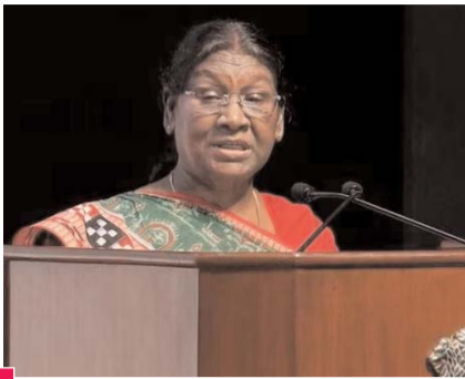
शहरी विकास में समग्र निवेश पिछले दशकों में दोगुना से अधिक हुआ है : द्रोपदी मुर्मू

इंदौर , 27 सितम्बर (एजेंसियाँ)। इंदौर में आयोजित स्मार्ट सिटी कॉफ्रेंस में राष्ट्रपति द्रोपदी मुर्मू ने इंदौर को देश के सबसे स्मार्ट शहर और एमपी को बेस्ट स्टेट का अवार्ड सौंपा। जलवायु परिवर्तन पर अपनी चिंता जाहिर करते हुए उन्होंने कहा कि देश में जलवायु परिवर्तन एक बड़ा मुद्दा है। हमें राष्ट्रीय स्तर पर इसके लिए काम करना होगा। उन्होंने स्मार्ट शहरों में किए जा रहे कार्यों को सकारात्मक पहल बताया। इस दिशा में और टिकाऊ विकास पर और अधिक काम किए जाने की जरूरत है। राष्ट्रपति इंडिया स्मार्ट सिटी कान्वल्वेव-2023 में सभी पुरस्कार विजेताओं को बधाई दी। उन्होंने कहा कि शहरी विकास में समग्र निवेश पिछले दशकों में दोगुना से अधिक हुआ है। स्मार्ट सिटी मिशन का इसमें बड़ा योगदान है।