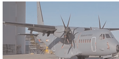
2021 में भारत में इन सैन्य सार्वजनिक ट्रांसपोर्ट एयरक्राफ्ट के लिए एयरबस से समझौता किया था

तैयारियों के तहत टोंक, जयपुर और दौसा के नेताओं को सभा में भीड़ जुटाने की जिम्मेदारी सौंपी गई