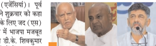
वह भाजपा और जद (एस) गठबंधन का स्वागत करते हैं। गठबंधन से ज्यादा सीटें जीतना संभव है। इस संबंध में नई दिल्ली में बातचीत चल रही है - येदियुरप्पा

बंगलुरु, 8 सितम्बर (एजेंसियाँ)। पूर्व मुख्यमंत्री बी.एस. येदियुरप्पा ने शुरुआत को कहा कि आगामी लोकसभा चुनाव के लिए जद (एस) के साथ गठबंधन से कर्नाटक में भाजपा मजबूत होगी। इस बीच, उपमुख्यमंत्री डी.के. शिवकुमार ने दावा किया कि आने वाले दिनों में जद (एस) का अस्तित्व रहेगा या नहीं यह भी ठीक-ठीक नहीं कहा जा सकता। येदियुरप्पा ने फ्रॉन्ट पार्क में पत्रकारों से बात करते हुए कहा कि वह भाजपा और जद (एस) गठबंधन का स्वागत करते हैं। गठबंधन से ज्यादा सीटें जीतना संभव है। इस संबंध में नई दिल्ली में बातचीत चल रही है। जद (एस) के शीर्ष नेता और पूर्व प्रधानमंत्री एच.डी. देवगौड़ा ने प्रधानमंत्री नरेंद्र मोदी और केंद्रीय गृह मंत्री अमित शाह से बात की थी। दोनों पार्टियों के नेता इस पर सहमत हो गए हैं। येदियुरप्पा ने कहा, 'अमित शाह जद (एस) को चार एमपी सीटें देने पर सहमत हो गए हैं। भाजपा जद (एस) को चार संसदीय सीटों पर चुनाव लड़ने देगी और वह बाकी सीटों पर चुनाव लड़ेगी।' इससे हमें अधिक सीटें जीतने में मदद