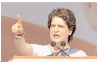
गहलोत ने गांवों में भी इंदिरा रसोई से सस्ता भोजन उपलब्ध बनाने की घोषणा की थी। इसे इंदिरा रसोई ग्रामीण योजना के नाम से चलाया जाएगा।

जयपुर, 8 सितम्बर (एजेंसियाँ)। राजस्थान के टोंक जिले के निवासी में कांग्रेस नेता प्रियंका गांधी 10 सितम्बर को इंदिरा रसोई ग्रामीण योजना का शुरुआत करेंगी। इंदिरा रसोई ग्रामीण योजना का शुरुआत को लेकर तैयारियाँ बुद्धिपूर्वक पर चल रही हैं। झिलाई गांव के विवेकानंद मॉडल स्कूल में योजना का शुभारंभ करने के बाद कांग्रेस नेता प्रियंका गांधी का सभा को संबोधित करने का कार्यक्रम है। सभा में मुख्यमंत्री अशोक गहलोत, प्रदेश प्रभारी सुखजिंदर सिंह रंधावा, प्रदेश अध्यक्ष गोविंद सिंह डोटासरा समेत वरिष्ठ कांग्रेस नेता और मंत्री मौजूद रहेंगे। तैयारियों के तहत टोंक, जयपुर और दौसा के नेताओं को सभा में भीड़ जुटाने की जिम्मेदारी सौंपी गई है। अभी तक शहरों में आठ रूप में खाना परोसने की योजना चल रही है। महलोल ने गांवों में भी इंदिरा रसोई से सस्ता भोजन उपलब्ध बनाने की घोषणा की थी। इसे इंदिरा रसोई ग्रामीण योजना के नाम से चलाया जाएगा। चुनावी साल में शहरों और गांवों में आठ रूप में खाना मुहैया कराने की योजना को राजनीतिक फायदे के लिए अहम माना जा रहा है। महिला मतदाताओं पर ध्यान केंद्रित करते हुए गहलोत सरकार ने हाल ही में 25 लाख