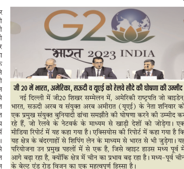
जी 20 में भारत, अमेरिका, सऊदी व यूएई को रेलते सौदे की घोषणा की उम्मीद

नई दिल्ली, 8 सितम्बर (एजेंसियाँ)। भारत ने शुरुआत को जी20 शिखर सम्मेलन में चीनी राष्ट्रपति शी जिनपिंग की अनुपस्थिति और यूक्रेन संघर्ष पर वार्ता के पट्टी से उतरने की आशंका को यह कह कर महत्व नहीं दिया कि वह सभी देशों को एक मंच पर लाने में कामयाब रहा है। यह अगले दो दिनों में शिखर सम्मेलन के दौरान दिखेगा। जी20 शिखर सम्मेलन पहले प्रेस कॉन्फ्रेंस को संबोधित करते हुए जी20 शेरपा अमितोष कांत ने कहा कि चीन एक बहुपक्षीय खिलाड़ी है और बहुपक्षीय चर्चा में मुद्दे द्विपक्षीय मुद्दों से अलग होते हैं। कांत ने शी की अनुपस्थिति से कार्यक्रम पर प्रभाव पड़ने के सवाल का जवाब देते हुए कहा, 'चीन