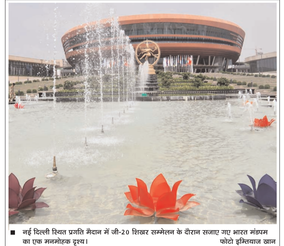
नई दिल्ली स्थित प्रगति मैदान में जी-20 शिखर सम्मेलन के दौरान सजाए गए भारत मंडपम का एक मनमोहक दृश्य।