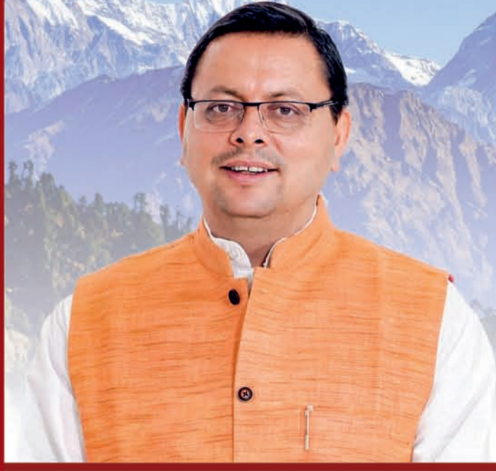
पुष्कर सिंह धामी मुख्यमंत्री, उत्तराखण्ड