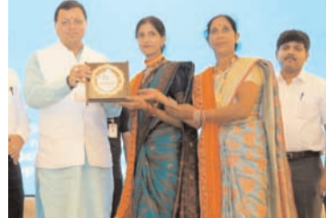
■ 17 व्यक्ति व संस्था एसडीजी एचीवर अवार्ड से सम्मानित ■ मुख्यमंत्री किया सम्मानित

मुख्यमंत्री पुष्कर सिंह धामी ने कहा कि विकास के लक्ष्य को हासिल करने के लिये सभी को सम्मिलित रूप से प्रयास करने होंगे। आत्मनिर्भर उत्तराखण्ड बनाने के लिए सबको समन्वित प्रयास करने होंगे। बहुत सी संस्थाएं और व्यक्ति सामाजिक, आर्थिक व पर्यावरण के क्षेत्र में बेहतर काम कर रहे हैं। वे सभी राज्य के विकास के ब्राण्ड एम्बेसेडर हैं। उत्तराखण्ड को श्रेष्ठ राज्य बनाने के लिये