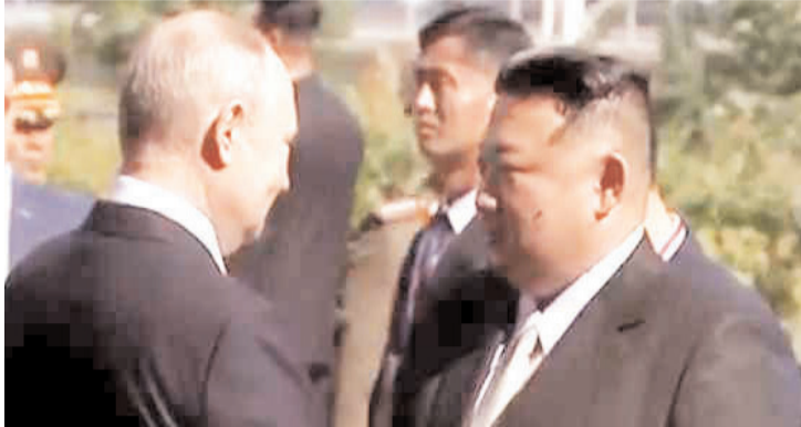
पुतिन के साथ बैठक में कहा, हमारी दोस्ती अब पहली प्राथमिकता रूस के साथ की जड़ें गहरी हैं, और हमारे देश के लिए संबंध हैं। उत्तर कोरियाई नेता ने उन्हें

बुधवार को रूस के साथ प्योंगयांग के संबंधों को अपने देश की पहली प्राथमिकता बताया। श्री किम ने रूस के वोस्तोचन स्पेसपोर्ट पर रूसी राष्ट्रपति व्लादिमीर