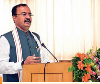
गांव में स्वच्छता व जन सुविधाओं के लिए गुजरात मॉडल पर कार्य करें : केशव मौर्य

लखनऊ, 13 सितम्बर (देशबन्धु)। उपमुख्यमंत्री केशव प्रसाद मौर्य ने ग्राम्य विकास विभाग के अधिकारियों को निर्देश दिए हैं कि वह गांवों में रचनात्मक कार्य कर विकास की पवित्र गंगा बहाएँ, विकास कार्यों में नवाचार करके नई मिसाल स्थापित करें। उन्होंने कहा कि अधिकारी/कर्मचारी टीम भावना से कार्य करके गांव में विकास के नए कीर्तमान स्थापित करें। उन्होंने कहा कि विकास कार्यों में ऐसी सरल, सहज, सुलभ व सर्वग्राही कार्य संस्कृति डेवलप करें, कि आम जनमानस को उनकी बुनियादी आवश्यकताओं की पूर्ति