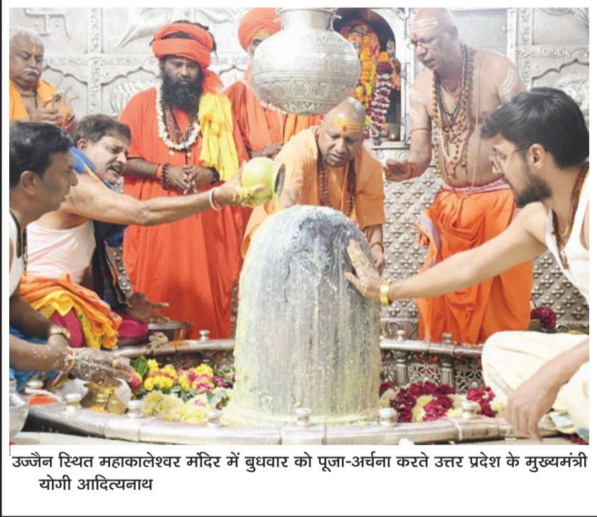
उज्जैन स्थित महाकालेश्वर मंदिर में बुधवार को पूजा-अर्चना करते उत्तर प्रदेश के मुख्यमंत्री योगी आदित्यनाथ

लॉस एंजिल्स, 13 सितम्बर (एजेंसियां)। अमेरिका की अंतरिक्ष एजेंसी नासा के अंतरिक्ष यात्री क्रैक रबियो ने अंतरराष्ट्रीय अंतरिक्ष स्टेशन (आईएसएस) पर सबसे लंबी यात्रा का कीर्तिमान स्थापित किया है। एजेंसी ने मंगलवार को यह जानकारी दी। रबियो ने सोमवार को अंतरिक्ष में लगातार 355 दिन बिताए गये एकल अंतरिक्ष उड़ान रिकॉर्ड को पीछे छोड़ दिया, जिसे नासा के अंतरिक्ष यात्री मार्क वंदे हेई ने 30 मार्च, 2022 को बनाया था। नासा ने कहा कि रबियो 27 सितंबर को अंतरिक्ष में 371 दिन बिताने के बाद वापस पृथ्वी पर लौटने की उम्मीद है। एजेंसी ने कहा कि सितंबर 2022 में आईएसएस पर जाने के बाद से रबियो ने रेंडोमिक्स, अंतरिक्ष भौतिकी और जीव विज्ञान से जुड़े कई प्रयोगों पर काम किया है और उन्होंने तीन स्पेसवॉक में भाग लिया है।