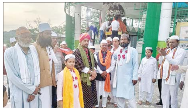
जबलपुर, देशबन्धु। मदन महल पहाड़ी पर स्थित पीराने की दरगाह में इस्लामिक माह सफर के आखिरी बुध को