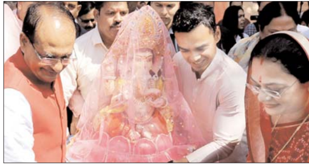
मुख्यमंत्री शिवराज चौहान स्वर्ण सपरिवार श्री गणेशजी की प्रतिमा लेकर स्थापना हेतु मुख्यमंत्री निवास पहुंचे जहां विधि-विधान से विधेयक को स्थापित किया गया।

चेन्नई, (एजेंसियां)। भारतीय अंतरिक्ष एजेंसी ने मंगलवार तड़के आदित्य-एल1 और वेदशांला को ट्रांस-लैंग्विजल प्लॉट पर सफलतापूर्वक स्थापित करके सूर्य की ओर रवाना किया। भारतीय अंतरिक्ष अनुसंधान संगठन (इसरो) के अनुसार, देश की अंतरिक्ष-आधारित सौर वेदशांला आदित्य-एल1 को मंगलवार सुबह 2 बजे ट्रांस-लैंग्विजल प्लॉट पर स्थापित किया गया। इससे ने कहर, अंतरिक्ष यान अब एक प्रक्षेप पथ पर है, जो इसे सूर्य-पृथ्वी एल1 बिंदु पर ले जाएगा। इसे लगभग 110 दिनों के बाद एक प्रकिया के माध्यम से एल1 के आसपास की कक्षा में स्थापित किया जाएगा। यह लगातार पांचवीं बार है, जब इसरो ने किसी वस्तु को अंतरिक्ष में किसी अन्य ग्लोबल प्लॉट या स्थान की ओर सफलतापूर्वक स्थानांतरित किया है।