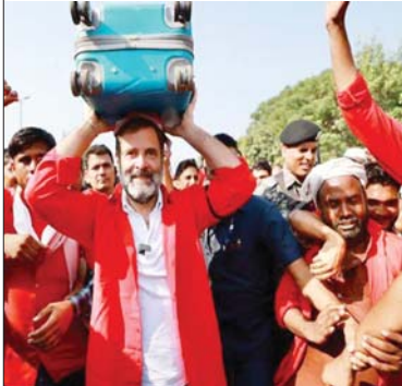
बहुत प्यार से बुलाया भी था और भारत के मेहनती भाइयों की इच्छा हर कीमत पर पूरी होनी चाहिए।

बात की और उनके सामने आने वाले मुद्दों पर चर्चा की। कांग्रेस नेता का दौरा कुएँ महीने बाद हो रहा है, जब कुएँ कुलियों से बातचीत कर उनकी समस्याओं पर बात कर एक बार फिर लोगों को चौंका दिया। राहुल उन्होंने कुली की लाल यूनिफॉर्म पहनी और बैज भी लगावा। इसके बाद उन्होंने सिर पर सामान उठाया। इस दौरान उनके साथ मौजूद कुली राहुल गांधी जिंदाबाद के नारे लगाते नजर आए। गांधी ने उनसे विस्तार से