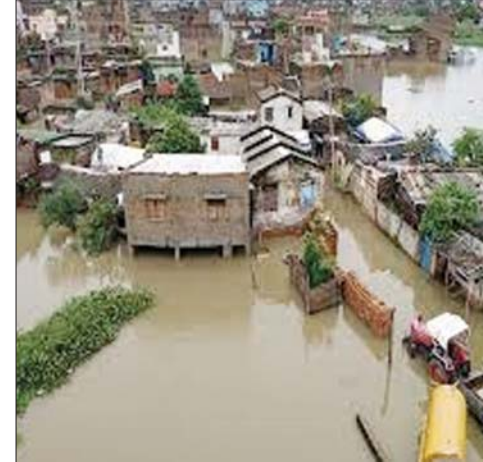
में लिया, मकान, फसल और मवेशी से लेकर कारोबार तक पर इसका असर हुआ।

भोपाल, (एजेंसियां) । मध्य प्रदेश के कई हिस्सों में हुई बारिश और उसके बाद नर्मदा नदी पर बने बांधों का जलस्तर बढ़ने से चार जिलों के डेढ़ सौ से ज्यादा गांव में बड़ा नुकसान हुआ है। नर्मदा बचाओ आंदोलन का आरोप है कि प्रशासन के जल स्तर के गलत निर्धारण की वजह से हजारों परिवारों की जिंदगी को मुश्किल भरा बना दिया है। बीते दिनों की बारिश से बांधों का जलस्तर बढ़ा तो वहीं बैंक वाटर भी गांवों तक पहुंच गया। इसके चलते धार, बड़वानी, खरगोन व अलिराजपुर के कई गांव पर असर पड़ा। एक तरफ जहां मकान डूब में आ गए तो फसलों को भी बड़ा नुकसान हुआ। आँकारेश्वर बांध से पानी छोड़े जाने से आँकारेश्वर सहित कई गांवों को नुकसान हुआ, नर्मदा नदी के किनारे बसे मकानों के अलावा दुकानों को भी पानी ने अपनी चपेट में लिया था। वहीं, सरदार सरोवर परियोजना के बैंक वाटर ने कई गांव को अपनी चपेट