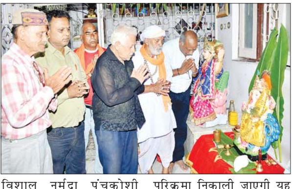
विशाल नर्मदा पंचकोशी परिक्रमा निकाली जाएगी यह