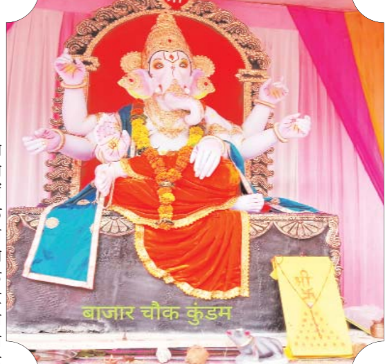
बाजार चौक कुंडम