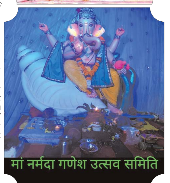
मां नर्मदा गणेश उत्सव समिति