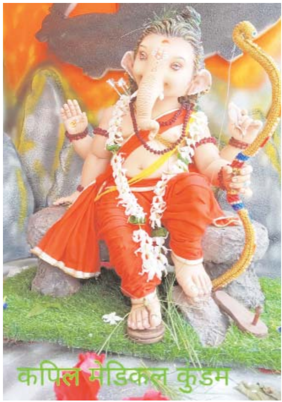
कपिल मेडिकल कुंडम