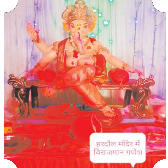
हरदोल मंदिर में विराजमान गणेश