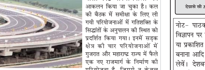
वाली 112 परियोजनाओं का आकलन किया जा चुका है। कल की बैठक में समीक्षा के लिए ली गयी परियोजनाओं में गतिशक्ति के सिद्धांतों के अनुपालन की स्थिति को प्रदर्शित किया गया। इनमें सड़क क्षेत्र की चार परियोजनाओं में गुजरात और महाराष्ट्र राज्य में फैले एक नए राजमार्ग के निर्माण की परियोजना है, जिससे न केवल नवसारी, नासिक, अहमदनगर जिलों में औद्योगिक बेल्ट बल्कि क्षेत्र के कृषि क्षेत्र को भी लाभ होगा। ऐसी ही दूसरी परियोजना गुजरात में बनसकांडा, पाटन, महसाणा, गांधीनगर और अहमदाबाद जिले से जुड़े नए राजमार्ग के विकास की है।

नई दिल्ली। प्रधानमंत्री (पीएम) गतिशक्ति के अंतर्गत नेटवर्क प्लानिंग रूप (एनपीजी) की 56वीं बैठक में आधारभूत आर्थिक अवसंरचना क्षेत्र की कुल लगभग 52,000 करोड़ रुपये की लागत वाली छह परियोजनाओं की प्रगति का आकलन किया गया। वाणिज्य एवं उद्योग मंत्रालय की गुरुवार को जारी एक विज्ञप्ति के अनुसार इनमें सड़क परिवहन एवं राजमार्ग मंत्रालय के तहत आने वाली लगभग 45000 करोड़ रुपये की लागत वाली चार सड़क परियोजनाएं और लगभग 6700 करोड़ रुपये की कुल परियोजना लागत वाली रेल मंत्रालय (एमओआर) के तहत आने वाली दो रेल परियोजनाएं हैं। विज्ञप्ति के अनुसार नई दिल्ली स्थित यशोभूमि कन्वेंशन सेंटर में बुधवार को उद्योग संवर्धन