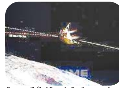
हिस्सा नहीं हैं लेकिन वे किसी अन्य तारे का चक्कर लगाते हैं। वे किसी और गैलेक्सी के भी हो सकते हैं।

श्रीहरिकोटा। चंद्रयान- 3 के लैंडर और रोवर के जागने की उम्मीद अभी इसरो ने छोड़ी नहीं है। 122 सितंबर को चंद्रमा के दक्षिणी ध्रुव पर सवेरा होने लगा था। इसके बाद से ही इसरो को सिग्नल का इंतजार है। अंतरिक्ष एजेंसी का कहना है कि आखिर पल तक उम्मीद कायम रहेगी। अभी चांद के इस भाग में रात होने में एक सप्ताह का समय है। हालांकि इसी बीच इसरो ने एक बड़ी खुशखबरी दी है। चंद्रमा पर भेजे गए रोवर और लैंडर भले ही अभी सो रहे हैं लेकिन उनके ले जाने वाला ऑर्बिटर अब भी चंद्रमा के चारों ओर चक्कर लगाता रहेगा। इसरो का कहना है कि यह अभी लंबे समय तक चंद्रमा और पृथ्वी के अतिरिक्त भी कई जानकारियां देता रहेगा।