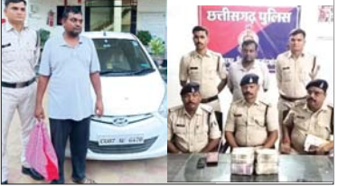
व्यक्तियों के द्वारा रेलवे विभाग में टिकट एकाग्रित करने पर पद नौकरी लगाने के नाम से विभिन्न कित्तों में 18,50,000/रु (अठारह लाख पचास हजार रु) लेकर प्रार्थी से ठगी किया है। कि रिपोर्ट पर अपराध क्रमांक 538/2023 धारा 402, 467, 468, 471, 34 भादवि कायम कर विवेचना में लिया गया। प्रार्थी वर्ष 2022 में खैरगढ़ पोलिटेकनीक कालेज में पढाई के दौरान जमान परचयन पदुमतर नवियारी रावोरी महिला को भी ठगे रेलवे विभाग में नौकरी लगाने की बात बतलाया था। इसके एवज में 13,00,000/रु (तेरह लाख) मॉता मिले थे एवं अपने बैंक अकाउंट के रूप में न्यूनतम पंढल नवियारी दुर्गे से निम्नरायण नाम की नौकरी लगाने का अधाशन दिया दोनों के

फर्जी ज्वैलिंग लेटर तैयार कर 18,50,000/रु (अठारह लाख पचास हजार रु की गयी ठगी आरोपी को जिला दुरा से किया गया गिरफ्तार आरोपी से नगदी रकम 14,00,000/-रु परये (चौदह लाख) एवं कार ड्रायव्हाउन क्रमांक सी.जी. 7 एयू 6470 जप्त