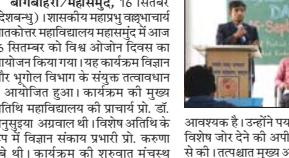
बागबाहरा/महासमुंद, 16 सितंबर (देशबन्धु) - विद्यार्थियों को शिक्षा में बढ़ रही बोझ, हो रही परेशानी और पीड़ा का दर्शन कोचिंग और ट्यूशन राहत के बजाय द रहे टेशन