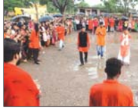
पलरी, 16 सितंबर (देशबन्धु) - विद्यार्थियों को शिक्षा में बढ़ रही बोझ, हो रही परेशानी और पीड़ा का दर्शन कोचिंग और ट्यूशन राहत के बजाय द रहे टेशन