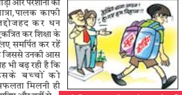
कोचिंग हब कोटा में बच्चों की निरंतर आलस्यता की गूँज

भाटापारा, 16 सितंबर (देशबन्धु) - विद्यार्थियों, 16 सितंबर (देशबन्धु) विद्यार्थियों को शिक्षा में बढ़ रही बोझ, हो रही परेशानी और पीड़ा का दर्शन कोचिंग और ट्यूशन राहत के बजाय द रहे टेशन