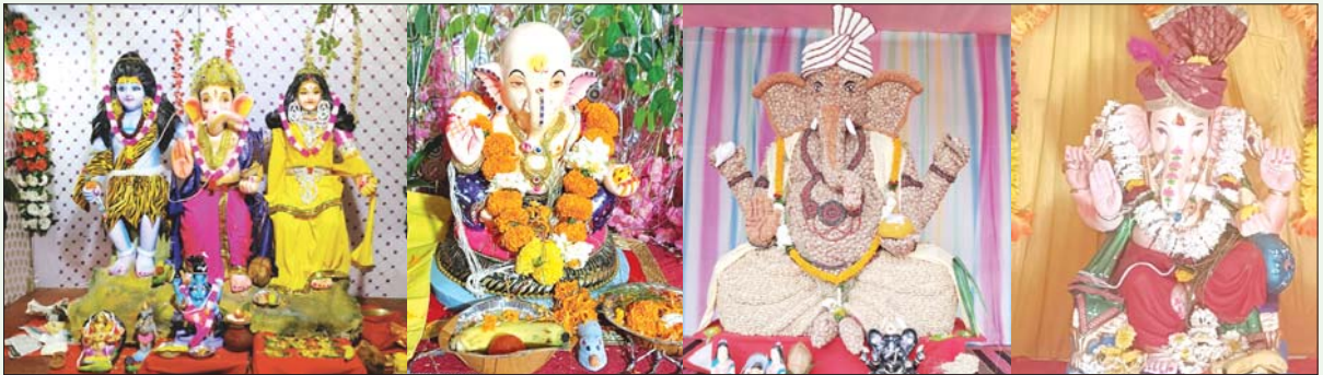
शिवशक्ति गणेशोत्सव समिति, अयोध्या नगर, मध्यप्रदेश श्रीमन्नमजानी मंदिर अयोध्या नगर शिवशक्ति गणेशोत्सव समिति, कम्प्लेक्स मार्केट चौक, पण्डरी रायपुर होम्योपैथिक मेडिकल कॉलेज, रामकुण्ड