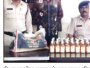
सिवा महारोवा तालाब के पास एक युवक अपने पास शराब के साथ थाना बिक्री

रायपुर, 26 सितंबर (देशावधि)। अन्य रम्यों से आने वाले शराब की तस्करी रोकने के साथ ही अवैध रूप से शराब की खरीदी-बिक्री करने वाले लोगों के संबंध में पतासाजी कर कार्रवाइ करने निदेशित किया गया है। जिसके तालतय में रायपुर पुलिस के समस्त पुलिस राजपत्रित अधिकारियों एवं प्रभारी ए.एस. सी. यू. सहित थाना प्रभारियों को एस.सी.सी. यू. सहित संचालन कर सुवर्धनी लगाने के साथ ही अन्य मामलों में भी जागरणीय एकाति किए जा रहे हैं। इसी क्रम में थाना डी.डी.नगर पुलिस को सूचना प्राप्त हुई कि थाना डी.डी.नगर क्षेत्रगत चंरोराभाटा