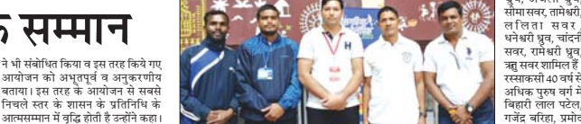
भवम में अभिषेक, बिल्लस में सधुम अक्वल।