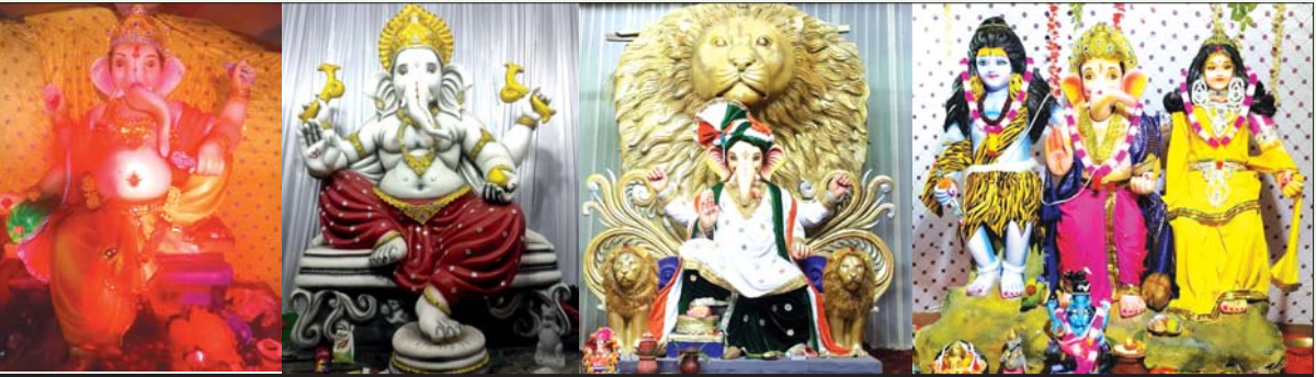
देवेन्द्र गणेशोत्सव समिति