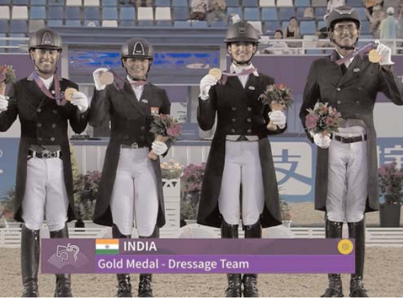
हंगकॉन्ग, 26 सितंबर (एजेंसियों)। भारत ने चार स्वर्णों के अलावा एक ब्रॉन्ज और एक रजत पदक जीता। भारतीय टीम में स्वर्ण पदक जीतने वाली एशियाई महिलाएं हैं।