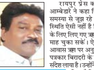
राजधानी में पत्रकार आवास के लिए मुख्यमंत्री दे सरकार