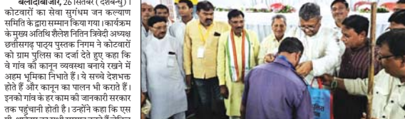
काटवागों को सवा सुगंधम जन कल्याण समिति के द्वारा सम्मान किया गया।

बनौतबाजार, 26 सितंबर (देखन्यू) | काटवागों को सवा सुगंधम जन कल्याण समिति के द्वारा सम्मान किया गया। इसका उद्देश्य अतिथि शहरवासियों को अतिथि अन्नदाता के रूप में सम्मान देना है।