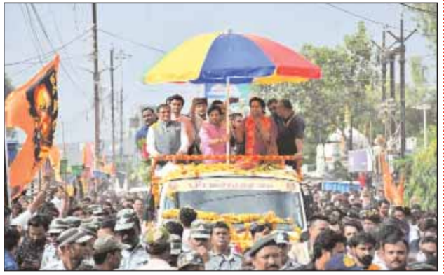
खुरई के लिए एतिहासिक और अविस्मरणीय क्षण थे। लोग जिनके आकर्षण में बंधे उनकी एक झलक पाने को बेताब रहते हैं वे स्वयं आज उनके द्वार पर उपस्थित हो रहे थे। शोभायात्रा का समापन सागर नाला में हुआ।

खुरई के लिए एतिहासिक दिन था, बागेश्वरधाम पीठाधीश्वर पं. धीरेन्द्रकृष्ण शास्त्री जब अपनी अन्नपूर्णा नगरी के उनके ही शब्दों में पालतों को दर्शन देने निकले तो जन समुद्र सड़कों पर उमड़ पड़ा। लोग घरों से निकल कर उनके वाहन की आरतियां कर रहे थे। फूलों की वर्षा कर रहे थे। सभी वादों की भजन मंडलियां झंझ मजीरों से बागेश्वर धाम की सवारी का स्वागत कर रहे थे। अपने निवास केके पैलेस की टैरिस से जनसमुदाय को दर्शन देकर बागेश्वर सरकार बायपास से रेलवे स्टेशन चौराहे तक पहुंचे। यहां से वे छतरी वाले रथ में बैठे। उनके साथ मंत्री भूपेंद्र सिंह भी थे। यहां से जनस्वराज उमड़ना आरंभ हुआ जो बढ़ता ही चला गया। परसा चौराहा, झंडा चौक, महाकाली शेड से सागर नाला तक की सड़क ब्रह्मालुओं द्वारा बरसाये गए फूलों से पट गई। अपनी चिर-परिचित बाल सुलभ मुद्रा में लोगों को आशीर्वाद दिया जनता का स्नेह और प्रेम स्वीकार किए। ज्यादातर घरों से परिवार निकल कर पूजा की थालियां लेकर उनका पूजन कर रहे थे। यह खुरई के लिए एतिहासिक और अविस्मरणीय क्षण थे। लोग जिनके आकर्षण में बंधे उनकी एक झलक पाने को बेताब रहते हैं वे स्वयं आज उनके द्वार पर उपस्थित हो रहे थे। शोभायात्रा का समापन सागर नाला में हुआ।