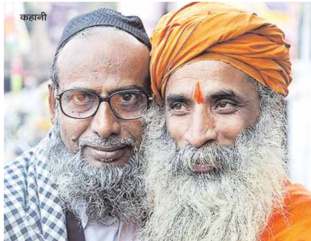
कहानी नर्स ने बगल वाले मरीज को उठाया। वह नहीं उठा। डाक्टर ने जूते से कम्बल उलट दिया और डॉक्टर कहा- 'उठो ?' बुद्धिया काँपकर उठ बैठी। 'यह आदमी कौन था ?' डाक्टर ने पूछा।

बरामदे में शान्ति थी। एक सुनसान कब्रगाह की तरह डरावनी खामोशी। मुरदे खामोश थे। एकाएक खटखट की आवाज हुई और एक नर्स बरामदे की सीढ़ियों पर चढ़ती हुई दीख पड़ी। चढ़ने में उसका मोजा नीचे खिसक गया और वह रुक कर उसे ठीक करने लगी। उसके जूतों की खटखट शायद किसी भुखमरे के बेहया दिल से जा टकराई।