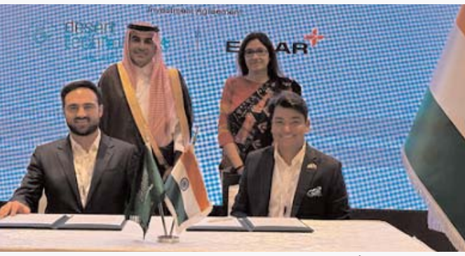
■ जी20 शिखर सम्मेलन में डेजर्ट टेक्नोलॉजीज और एस्सार ग्रुप के बीच एमओयू निष्पादित किया गया

इस साझेदारी के माध्यम से, डीटी और एस्सार सऊदी अरब में एस्सार के फ्लैट स्टील कॉम्प्लेक्स के लिए नवीकरणीय ऊर्जा उत्पादन और भंडारण