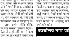
पारिजात, सामाजिक व राजनीतिक मुद्दों का वातावरण में चर्चा हुई।