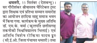
धमतरौ, 11 सितंबर (देशव्यापी) सर गौरीशंकर श्रावस्त्वर् चैरिटेबल ट्रस्ट द्वारा आयोजित शिक्षक एवं प्रतिभा विकास प्रोग्राममागरोह का शुभारंभ किया गया।