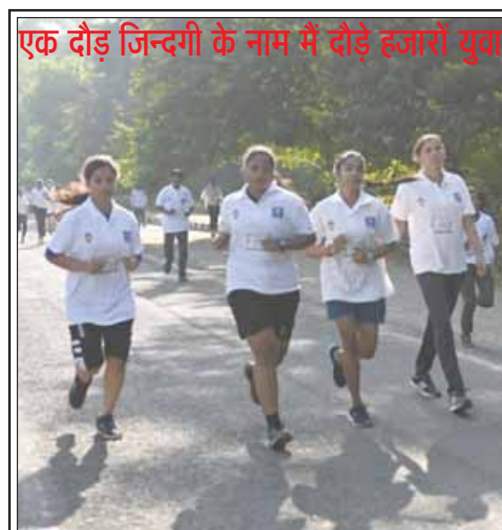
एक दौड़ जिन्दगी के नाम में दौड़े हजारों युवा

लड्डियों से कुंडली बनाई जाती है। मोती वाली इन कुंडलियों को टेबल टाप का रूप दिया जाता है, जो देखने में बहुत सुंदर लगता है। वहीं लाख को गर्म करके पिघलाने के बाद जमीन पर बिछाया जाता है। इसमें कांच के टुकड़े, चूड़ी के टुकड़े, विंदी और कृतिम आभूषणों को लाख अच्छी तरह से चिपकाकर छोटे-छोटे टुकड़े काट लिए जाते हैं। इन टुकड़ों में रिफ्लेक्ट पर लेपेट दिया जाता है, जिससे पेन, पेन स्टैंड, दीये आदि तैयार किए जाते हैं। इन सभी शिल्पियों का कहना है कि उनके उत्पादों को राजधानीवासियों द्वारा काफी पसंद किया जा रहा है।