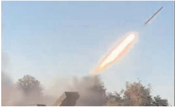
मास्को, 30 सितम्बर उरगन मल्टीपल लॉन्च रॉकेट (एजेंसियां) रूस ने कहा है कि सिस्टम (एमएलआरएस) से नौ