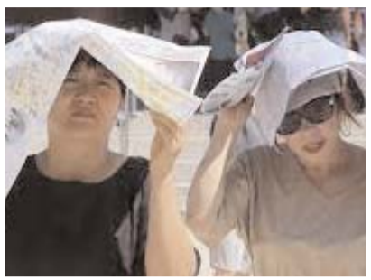
इस साल अब तक गर्मी से संबंधित बीमारियों से 32 लोगों की मौत हुई

चपेट में था, जून से अगस्त तक औसत राष्ट्रीय तापमान 24.7 डिग्री सेल्सियस तक पहुंच गया, जो अब तक का चौथा उच्चतम स्तर है। आंकड़ों से पता चलता है कि इस