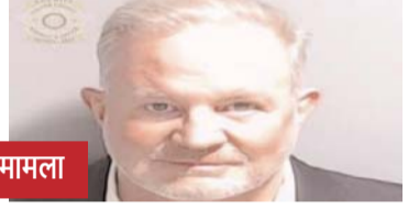
जॉर्जिया चुनाव मामला