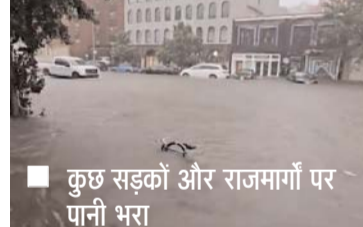
कुछ सड़कों और राजमार्गों पर पानी भरा

न्यूयॉर्क, 30 सितम्बर (एजेंसियां)। न्यूयॉर्क की गवर्नर कैथी होचुल ने मूसलाधार बारिश के कारण सबसे और सड़कों पर पानी भर जाने और उद्घाटनों में देरी के बाद न्यूयॉर्क शहर, लॉग आइलैंड और आसपास के क्षेत्र में आपातकाल की घोषणा कर दी है।