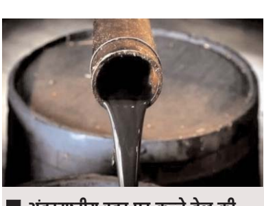
अंतरराष्ट्रीय स्तर पर कच्चे तेल की कीमतों में बढ़ोतरी का असर अक्टूबर-दिसंबर तिमाही में देखने को मिला। भारत का चालू खाता घाटा (सीएडी) बढ़ने और आने वाले समय में रुपये पर और अधिक दबाव की आशंका बढ़ गई।

नई दिल्ली, 2 अक्टूबर (एजेंसियां)। अंतरराष्ट्रीय स्तर पर कच्चे तेल की कीमतों में बढ़ोतरी का असर अक्टूबर-दिसंबर तिमाही में देखने को मिला है, जिससे भारत का चालू खाता घाटा (सीएडी) बढ़ने और आने वाले समय में रुपये पर और अधिक दबाव की आशंका बढ़ गई है। देश अपनी कच्चे तेल की आवश्यकता का लगभग 85 प्रतिशत आयात करता है और वैश्विक कीमतों में किसी भी वृद्धि से आयात खर्च बढ़ जाता है। चूंकि कच्चा तेल खरीदने के लिए बड़ा भुगतान डॉलर में करना पड़ता है, इसलिए अमेरिकी मुद्रा की तुलना में रुपया कमजोर होता है। ब्लूमबर्ग की रिपोर्ट के अनुसार, बेंचमार्क वेस्ट टेक्सस इंटरमीडिएट क्रूड जुलाई-सितंबर की तिमाही में 29 फीसदी की बढ़ोतरी के बाद सोमवार को 91 डॉलर प्रति बैरल से ऊपर पहुंच गया, जो लगभग दो दशकों में सबसे बड़ी तीसरी तिमाही बढ़त है। बेंचमार्क ब्रेंट क्रूड पहले से ही 95 डॉलर प्रति बैरल के आसपास मंडा रहा है। अंतरराष्ट्रीय बाजार में कच्चे तेल की बढ़ती कीमतों के कारण डॉलर की मांग बढ़ने से अमेरिकी डॉलर के मुकाबले भारतीय मुद्रा 83 रुपये के निचले स्तर पर आ गई है। पिछले सप्ताह जारी आरबीआई के आंकड़ों के