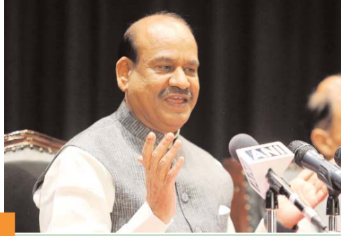
संसद में दूसरे देश के आंतरिक मामलों पर चर्चा नहीं हो सकती : ओम बिरला

पी-20 के सफल आयोजन को लेकर योगदान करने वाले सभी पक्षों के प्रति जताया आभार