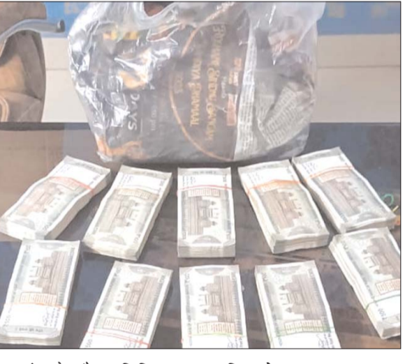
जांच के दौरान सिविल लाइन पुलिस ने देवकीनंदन चौक में एक सदिग्ध वाहन को न रुपये जब्त कर लिए हैं।

बिलासपुर, 15 अक्टूबर (देशबन्धु)। विधानसभा निर्वाचन आचार संहिता का कड़ाई से पालन कराने पुलिस की टीम अलग-अलग जगहों पर अभियान चलाकर जांच की जा रही है। शनिवार की रात चले अभियान के दौरान सिविल लाइन पुलिस ने एक वाहन से 93 लाख के जेवर जब्त किए हैं। वहीं, कोतवाली पुलिस ने खपरगंज में एक व्यक्ति से पांच लाख रुपये जब्त किए। पुलिस जेवर और रुपयों के संबंध में पूछताछ कर रही है। एसपी संतोष कुमार के निर्देश पर शहर के सभी थाना क्षेत्र में शनिवार की रात जांच अभियान शुरू किया गया। इस दौरान अलग-अलग जगहों पर 14 जांच पाईंट बनाए गए।