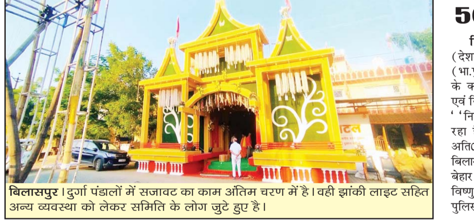
बिलासपुर। दुर्गा पंडालों में सजावट का काम अंतिम चरण में है। वहीं झांकी लाइट सहित अन्य व्यवस्था को लेकर समिति के लोग जुटे हुए हैं।