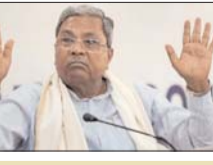
केंद्र से एनडीआरएफ के नियमों के तहत आर्थिक मदद की अपील

मुख्यमंत्री सिद्धारमैया ने बताया कि कर्नाटक सरकार ने सूखे की समस्या को गंभीरता को देखते हुए पहले 195 तालुका को सूखाग्रस्त घोषित किया था। उन्होंने कहा कि सूखे का संकट और बढ़ने के बाद कैबिनेट की सब-कमेटी ने 21 और तालुका को सूखाग्रस्त घोषित किया। इस तरह सरकार ने राज्य के कुल 216 तालुका को सूखाग्रस्त घोषित कर दिया है। किसानों के मुताबिक कर्नाटक सरकार ने केंद्र सरकार से 4860 करोड़ रुपये की आर्थिक मदद मांगी है। उन्होंने कहा कि नेशनल डिजास्टर रिसपॉन्स फंड के नियमों के मुताबिक कर्नाटक सरकार ने केंद्र सरकार से 4860 करोड़ रुपये की आर्थिक मदद मांगी है।