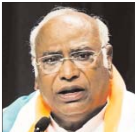
कांग्रेस अध्यक्ष ने कहा भाजपा जो कर रही है, वह ठीक नहीं है