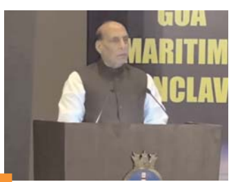
स्वतंत्र, खुली व नियम-आधारित समुद्री व्यवस्था हम सभी के लिए प्राथमिकता : राजनाथ सिंह