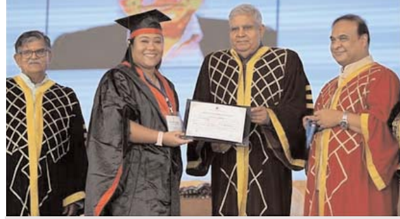
यदि हमारे पास गुणवत्तापूर्ण शिक्षा है तो अन्य चीजें भी अपने स्थान पर आ जाएंगी : जगदीप धनखड़

उपराष्ट्रपति ने कहा कि मुझे इसमें कोई शंका नहीं है कि शिक्षा ही समाज को बदल सकती है। समाज में बदलाव तब आएगा जब हम नए-नए खोज करेंगे। रिसर्च करेंगे। विकास करेंगे। जब हम आउट ऑफ बॉक्स जाकर सोचेंगे। तभी समाज में परिवर्तन आएगा। उन्होंने 21 सितंबर के दिन को भी याद किया जब संसद ने महिला आरक्षण बिल को पास किया। नरेंद्र मोदी के नेतृत्व में आधी आबादी को न्याय मिला। इससे पहले उपराष्ट्रपति जगदीप धनखड़ सोमवार को सुबह यहां एक कार्यक्रम में हिस्सा लेने के लिए गुवाहाटी पहुंचे। असम के राज्यपाल और मुख्यमंत्री ने यहां पहुंचने पर