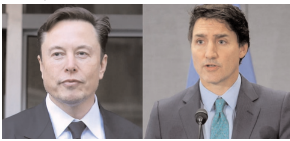
सैन फ्रांसिस्को, 2 अक्टूबर (एजेंसियां)। टेस्ला और स्पेसएक्स के सीईओ एलन मस्क ने सोमवार को कनाडा के प्रधानमंत्री जस्टिन ट्रूडो की अभिव्यक्ति की आजादी को कुचलने की कोशिश के लिए आलोचना की और इसे शर्मनाक बताया।