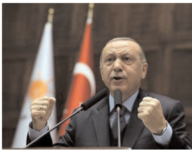
■ सभी राजनीतिक दलों और समाज के सभी वर्गों को इस प्रयास में शामिल होने के लिए आमंत्रित किया

अंकारा, 2 अक्टूबर (एजेंसियां)। तुर्की के राष्ट्रपति रेसेप तैयप एर्दोगन ने संसद के नए कार्यकाल में एक नया संविधान बनाने का संकल्प लिया है। राष्ट्रपति ने सभी राजनीतिक दलों और समाज के सभी वर्गों को इस प्रयास में शामिल होने के लिए आमंत्रित किया है। एर्दोगन ने संसद के नए विधायी वर्ष के उद्घाटन समारोह में एक भाषण में कहा, अब हमारे सामने एक नया कार्य और एक नया अवसर है। इसका उद्देश्य हमारे देश को एक नया और नागरिक संविधान देना है। उन्होंने कहा, हम सभी दलों, सभी सांसदों (संसद के सदस्यों), सभी सामाजिक वर्गों और इस मुद्दे पर अपनी राय और प्रस्ताव रखने वाले सभी लोगों को रचनात्मक समझ के साथ एक नए संविधान के आह्वान में शामिल होने के लिए आमंत्रित करते हैं। एर्दोगन