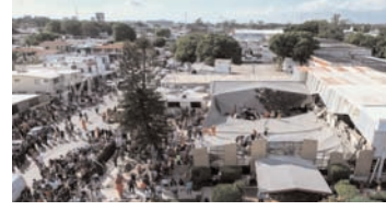
तलाश कर रहे हैं जिनके मलबे में फंसे होने की आशंका है। क्षेत्रीय सुरक्षा विभाग ने एकसमूह पर कहा, दस लोगों के मरने और 60 के घायल होने की सूचना है, जिनमें से 23 को अस्पताल ले जाया गया। दो लोगों की हालत नाजुक है।

मेक्सिको सिटी, 2 अक्टूबर (एजेंसियां)। मेक्सिकन शहर स्यूदा माइरो में एक चर्च की छत गिरने से नौ लोगों की मौत हो गई है और 40 अन्य घायल हो गए हैं। मेक्सिकन सार्वजनिक सुरक्षा सचिवालय के क्षेत्रीय विभाग द्वारा सोमवार को जारी रिपोर्ट में यह जानकारी दी। तमाउलिपास राज्य के सुरक्षा विभाग ने एकसमूह लिखा, इस हादसे में नौ लोगों की मौत और 40 के घायल होने की सूचना मिली है। आगे की जानकारी बचाव कार्य पूरा होने के बाद ही मिलेगी। मीडिया ने बताया कि बचावकर्मी अन्य 30 लोगों की