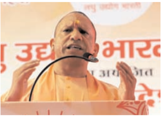
लघु उद्योगों से ही संभव होगा रोजगार सृजन और परिवारों का आर्थिक स्वावलंबन : योगी आदित्यनाथ

आगरा में पहली बार प्रदेशभर के 5 हजार से अधिक लघु उद्यमियों ने प्रतिभाग किया। लघु उद्यमियों को संबोधित करते हुए सीएम योगी ने कहा कि लघु उद्योग अर्थव्यवस्था की रीढ़ होता है। लघु उद्योगों से ही रोजगार सृजन और परिवारों का आर्थिक स्वावलंबन संभव है। साथ ही उद्यमियों को विश्वास दिलाते हुए कहा कि प्रदेश में कानून से खिलवाड़ करने वालों को छोड़ा नहीं जाएगा, चाहे वो कोई भी हो। मुख्यमंत्री ने लघु उद्योग भारती के उद्यमी महा अधिवेशन में प्रदेशभर से आएं उद्यमियों का ब्रजभूमि में प्रदेश सरकार की ओर से हृदय से स्वागत किया। उन्होंने उद्यमियों से संवाद करते हुए कहा कि ये मेरे लिए अमूल्य क्षण हैं। आज लघु उद्यमियों के साथ तीन महीने में अंदर आज तीसरी बार लघु उद्यमियों से संवाद करने का सौभाग्य प्राप्त हुआ है। आपने 21 से 25 सितंबर