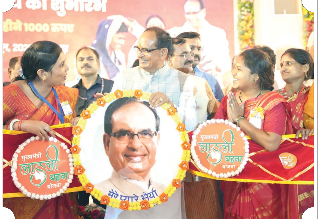
मुख्यमंत्री श्री शिवराज सिंह चौहान को जबलपुर में मुख्यमंत्री लाडली बहना योजना के राज्यस्तरीय समारोह में लाडली बहनों ने बड़ी राखी भेंट की।