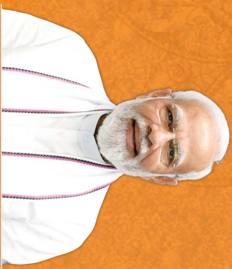
नरेन्द्र मोदी, प्रधानमंत्री

5 अक्टूबर, 2023 | 3पटाहन 3:00 | जबलपुर, मध्यप्रदेश