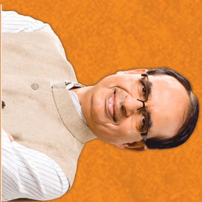
शिवराज सिंह चौहान, मुख्यमंत्री

नागापुर-जबलपुर गैस पाइप लाइन परियोजना 317 कि.मी. की गैस पाइप लाइन से मिलेगा प्राकृतिक गैस के उपयोग को बढ़ावा और शहरों को प्रदूषण से मुक्ति