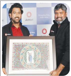
महेंद्र सिंह धोनी जियोमार्ट के ब्रांड एंबेसडर बने